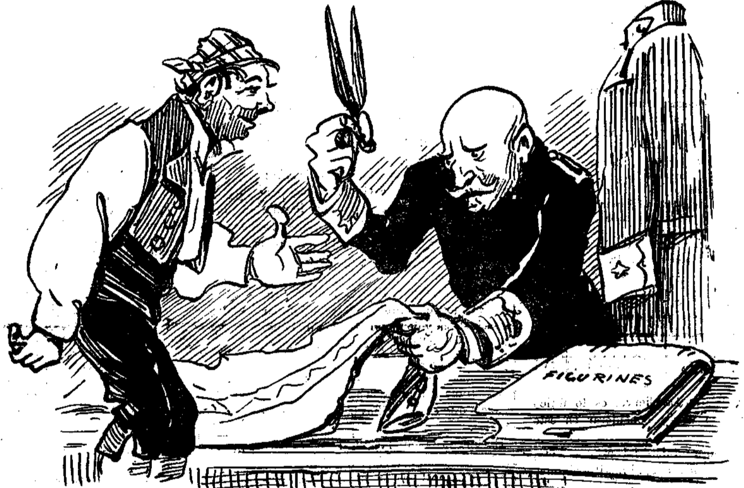
EL PAÍS.—¿Y no sería mejor, maestro, que se dedicara usted á reformar cuarteles, armamento, ley de reclutamiento, defensa de costas y fronteras, etc., etc.?