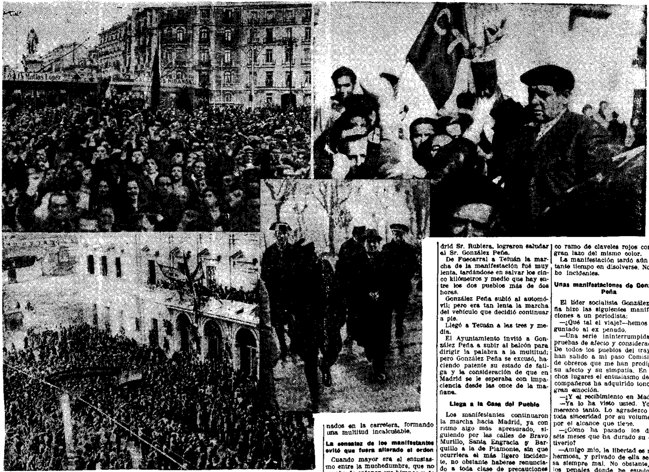
GONZALEZ PEÑA EN LIBERTAD.—Anteayer domingo llegó a Madrid el líder socialista señor González Peña. Una enorme muchedumbre le acompañó, desde mucho antes de su entrada en la capital de la República, hasta su llegada a la Casa del Pueblo. En todos los puntos por donde hizo su viaje saludaron al Sr. Peña numerosas Comisiones de los partidos del Frente Popular. Las presentes fotos representan: La imponente manifestación, a su paso por la plaza de Alonso Martínez.—González Peña saluda a la multitud, que le aclama, y aquel dirigiendo la palabra al pueblo de Tetuán de las Victorias.—En medio, una fotografía que ya es histórica: el Sr. González Peña es conducido esposado ante el Tribunal que lo había de juzgar por su participación en el movimiento revolucionario de Octubre, y en cuya vista fué condenado a muerte