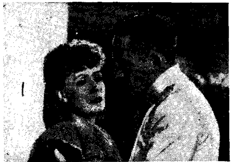
La genial Greta Garbo y Fredric March en su triunfal película «Ana Karenina», enorme éxito de la Metro-Goldwyn-Mayer en el Capitol