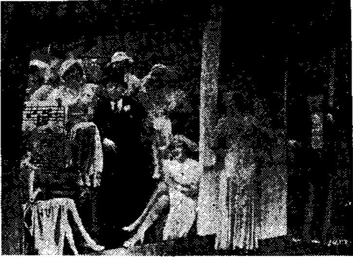
Una escena de «Cook-tail musical», film Paramount de gran espectáculo que se estrenará el lunes próximo en Hollywood Cinema