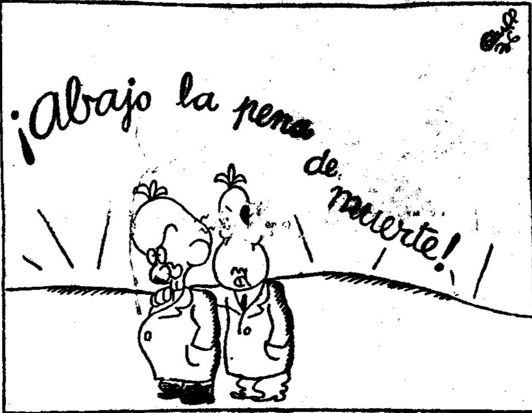
LOS TRAIADORES, por Bluff

—¿Qué significa ese grito? —Que nos Indultan.