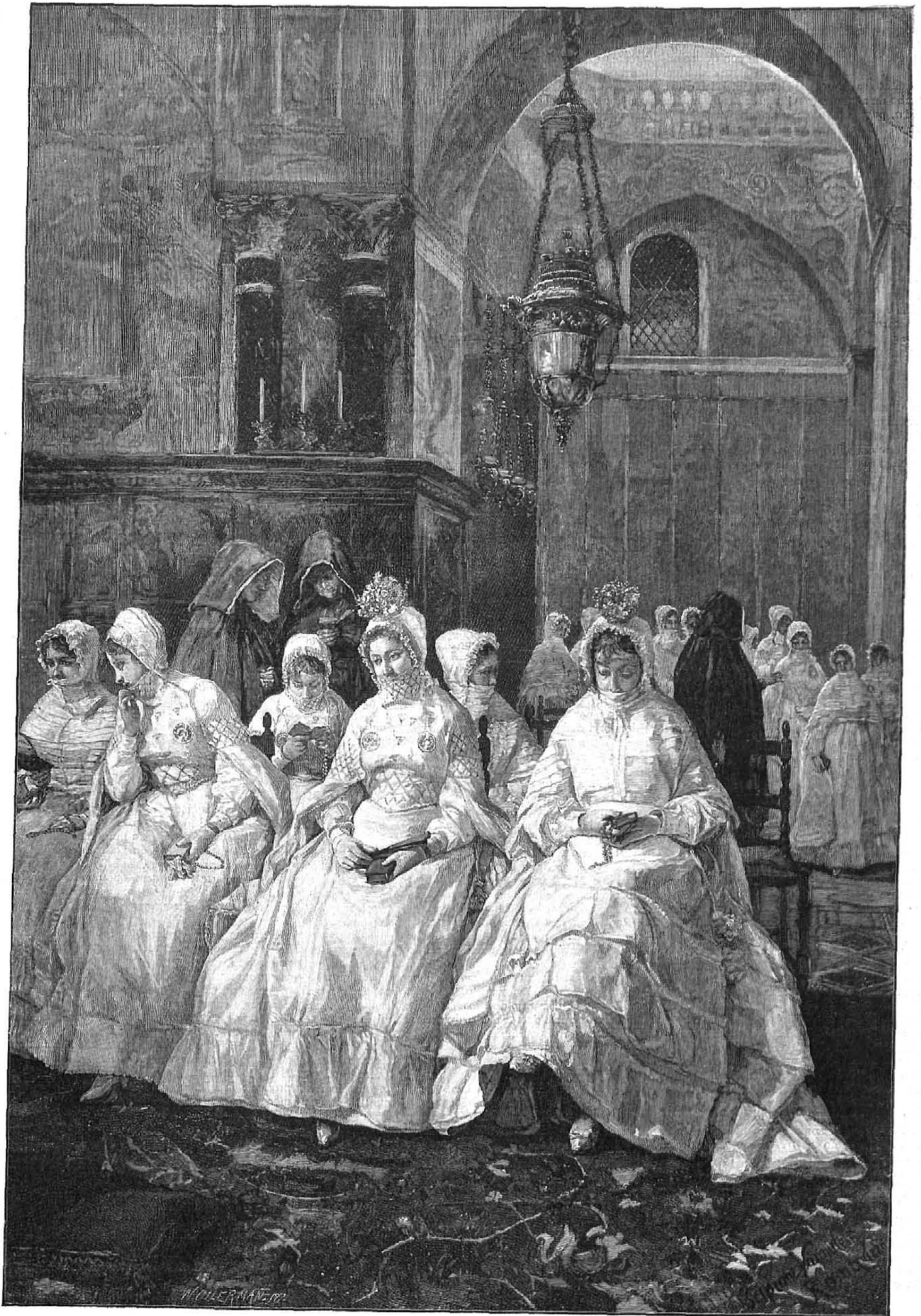
LA PRIMERA COMUNIÓN, cuadro de Escipión Vanutelli