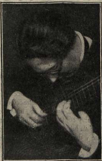
Cuya tournée en Norte América constituye un grandioso éxito.