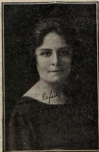
Notable pianista francesa que ha actuat con verdadero éxito en el Norte de Europa.