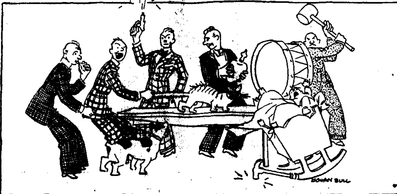
La evolución en la música © Biblioteca Nacional de España (De la revista Pro-Arte Musical, Habana)