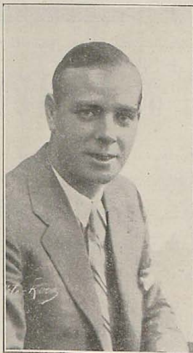
Zamora, crítico hoy de fútbol, demuestra en sus artículos y en sus co-

tuaciones hace ya muchos años el equipo español.