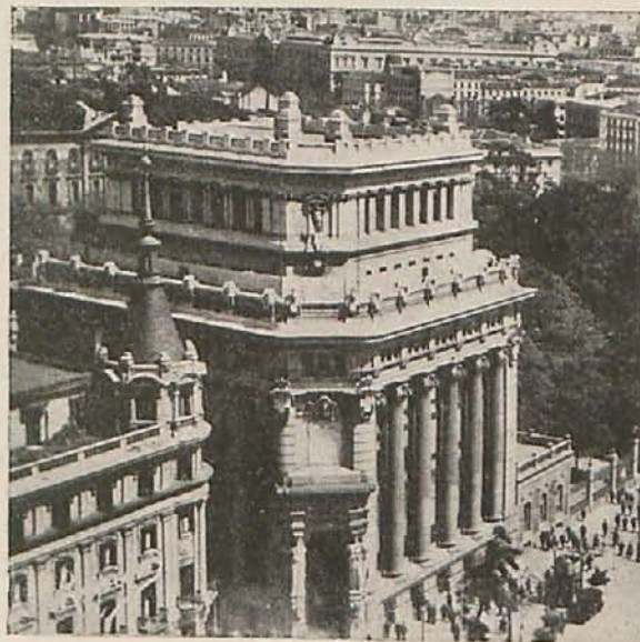
Edificio del Banco Central.

en su sede social, ALCALA, 57, MADRID y en sus 121 sucursales y agencias