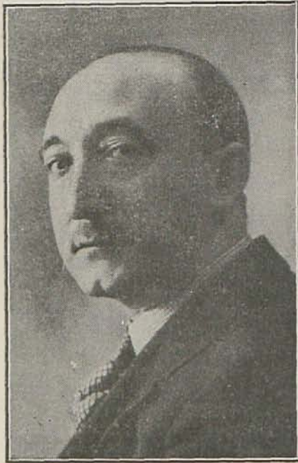
Fernández Flórez, Académico de la Española... Parece que los hombres nuevos no han aportado a la antigua institución ideas nuevas. ¿Sigue siendo aún actual el verso de Darío...?