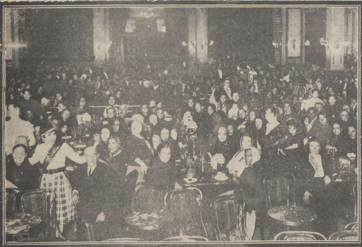
Las artistas de variedades que actúan en el Palace, sirviendo en la «brasserie», a los pobres del distrito del Congreso, la comida con que les ha obsequiado esta mañana la empresa del Hotel.