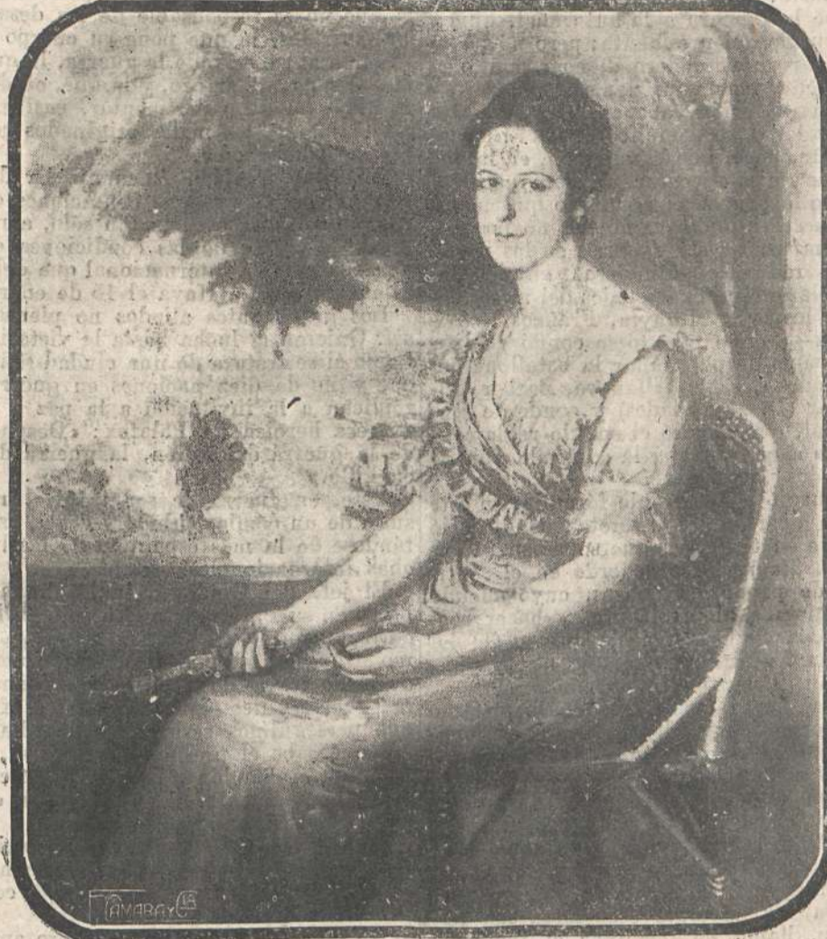
Retrato de la bella Srta. de Pradera, magnífica obra del ilustre pintor Marcelino Santa María, uno de nuestros mejores retratistas.