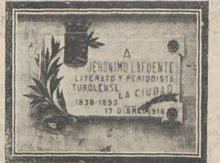
Lápida colocada en la casa donde nació, en Teruel, el ilustre literato y periodista D. Jerónimo Lafuente.