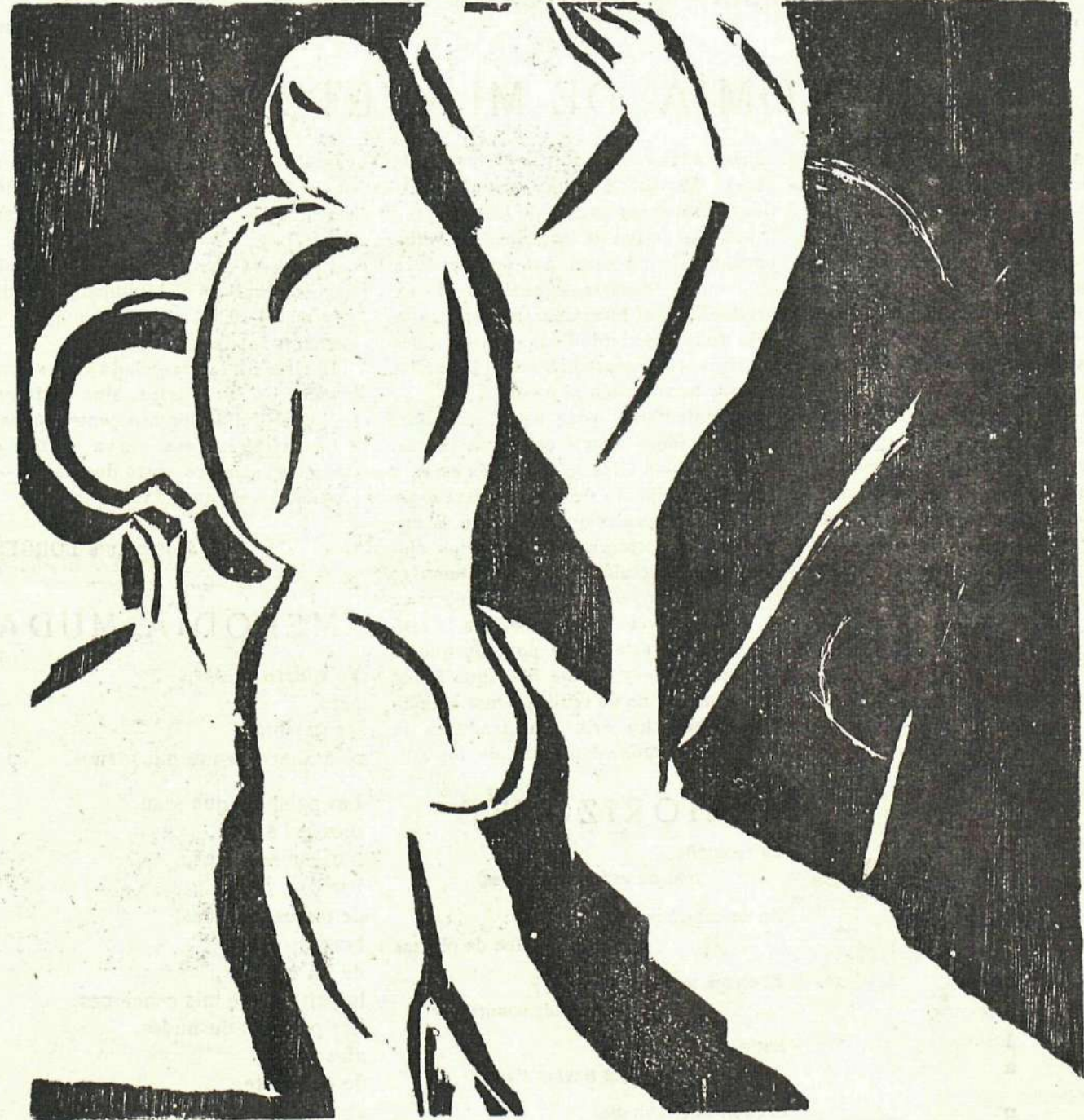
Grabado en madera.