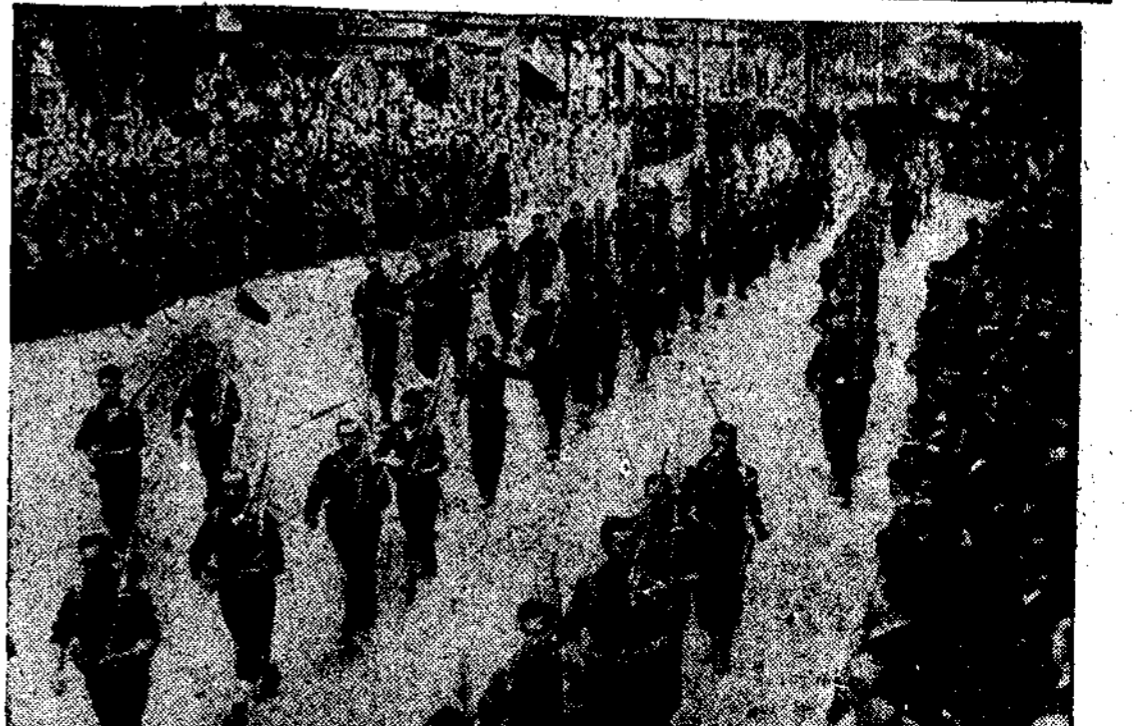
BILBAO.—Un batallón de milicias desfilando ante el nuevo Gobierno del País Vasco