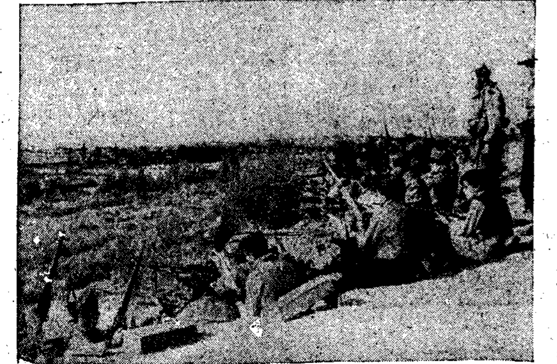
Una de nuestras magníficas trincheras del sector del Centro, desde donde nuestros soldados atacan a los fasciosos.

No decimos nada de esto por vanidad personal, que no sentimos. Demos cuenta a nuestros lectores de unos hechos pasados, que son prenda y garantía de cuál habrá de ser nuestra actuación en el futuro.