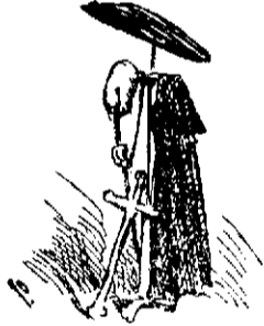
La pesadilla del general Córdova.

(Se continuará, pues por esta vez no se ha recibido más inspiración. ¡Qué servicio de correos!)