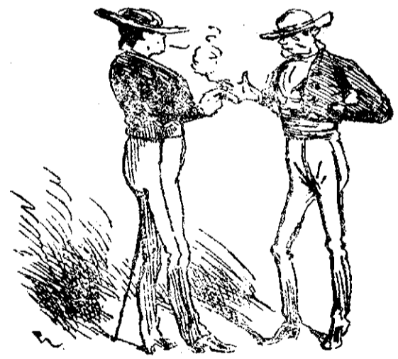
—A mí, Lagartijo. —A mí, Frascuelo.