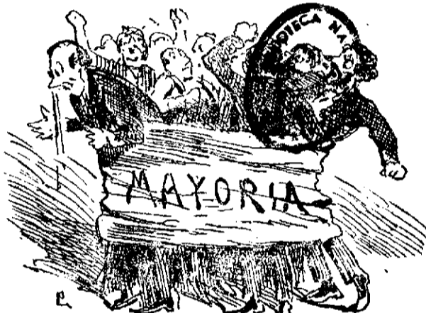
La mayoría sigue compacta y apretada.