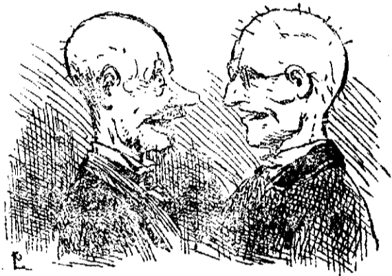
Aceite de bellotas con sávia de cuco.