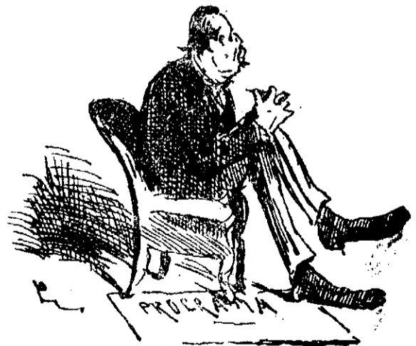
¡Qué descansada vida!