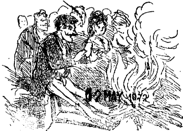
El haz de leña, (drama de invierno).