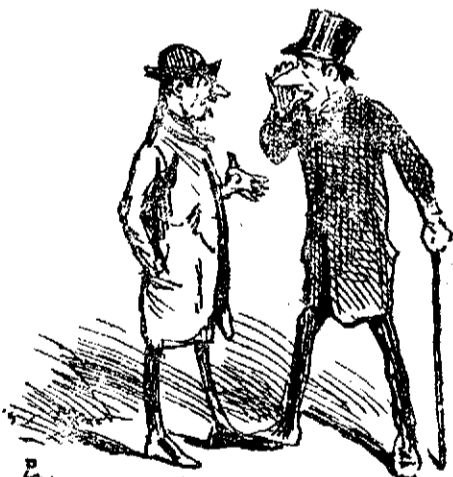
—¡Pero hombre, qué la cronos!