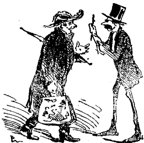
Se prende al general Contreras por no tener barbas.