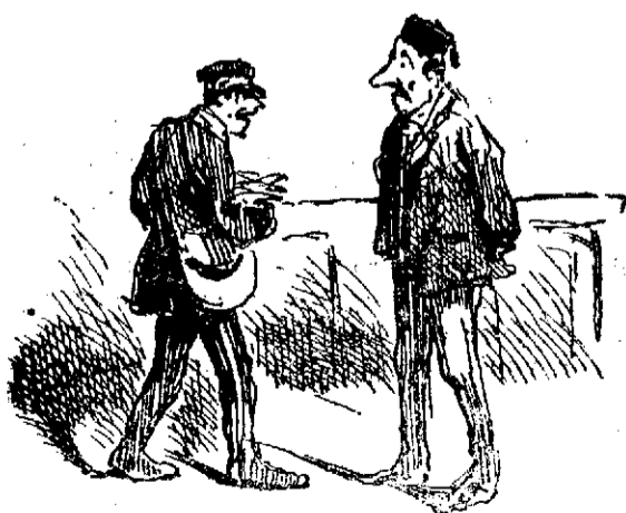
—¿I legó el correo de Cataluña? —Los carlistas no lo han tenido á bien. —Quien manda manda.