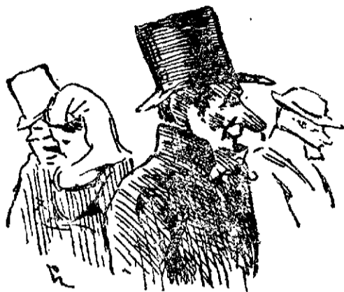
Ayer heló en toda España. (La Correspondencia).