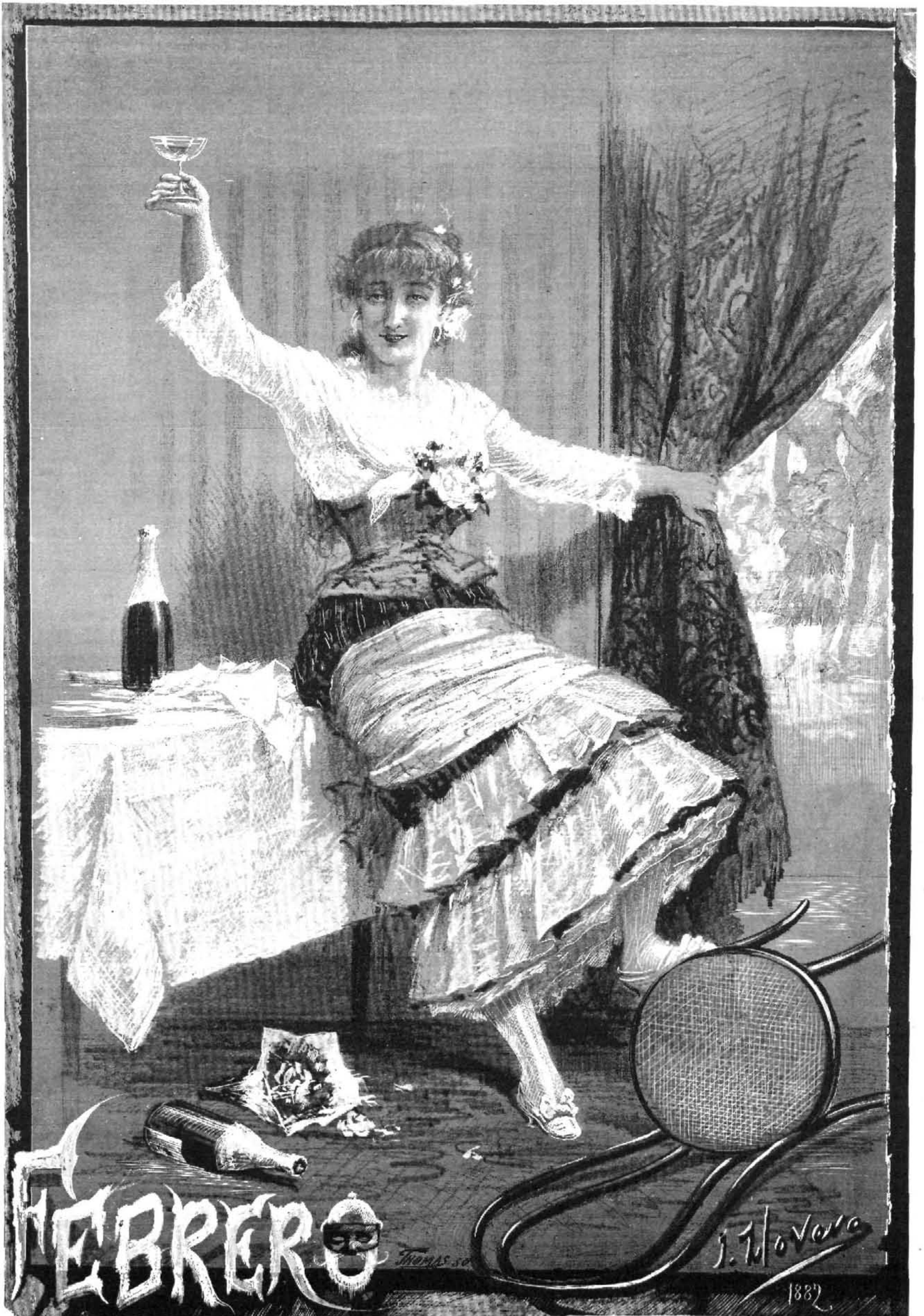
EL MES DE FEBRERO, por Llovera