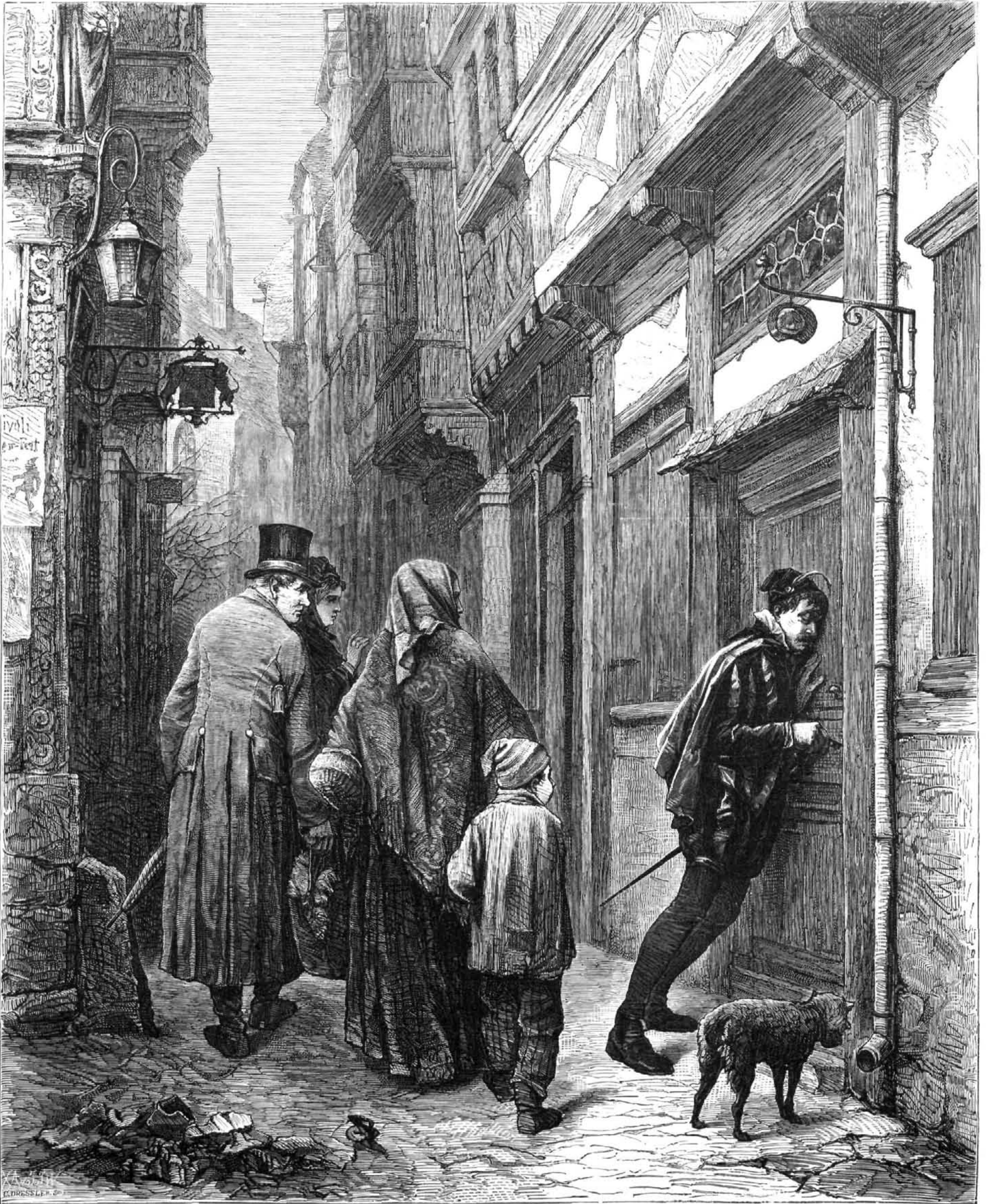
DESPUES DEL BAILE, por N. Luben