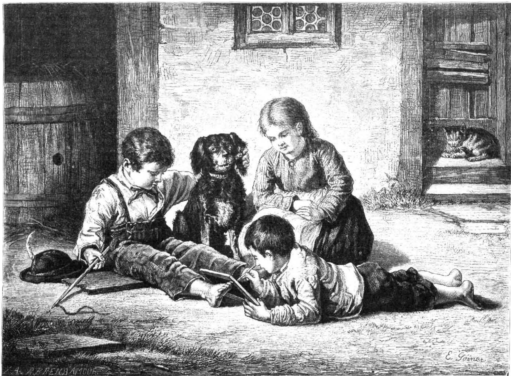
UN MODELO, por Gornier

lidad humana—la libertad de la palabra, la libertad de la ciencia, la libertad del trabajo—y haber declarado que el trabajo pertenece al trabajador; no al que le hace trabajar con el látigo inhumano.