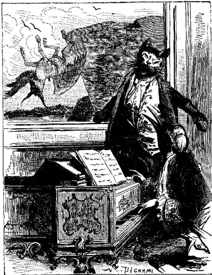
El gato y el ruiseñor

El claustro de la Catedral es obra de fines del siglo xiv ó principios del xv. Lo principió el arquitecto Roque, lo continuó Gual y cerró su última bóveda Andrés Escuder. Aunque más ligero y caprichoso, su estilo responde al del templo. Merecen ciertamente especial atención las esbeltas columnas que sostienen los arcos en gradación de ojiva, y en sus múltiples y variados ca-