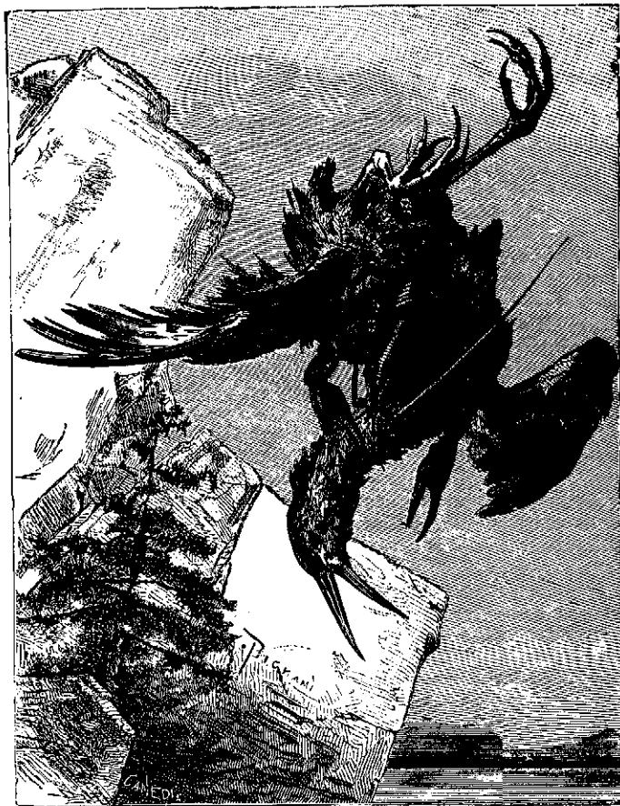
Contra los poderosos ayuda la astucia

Vivía cierta vez á orillas de un lago un pajarraco que, habiéndose hecho