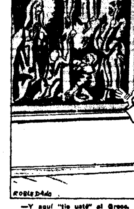
—Y aquí "He usó" al Greco, que, además de gran pintor, fué el inventor de la línea apocriofa.