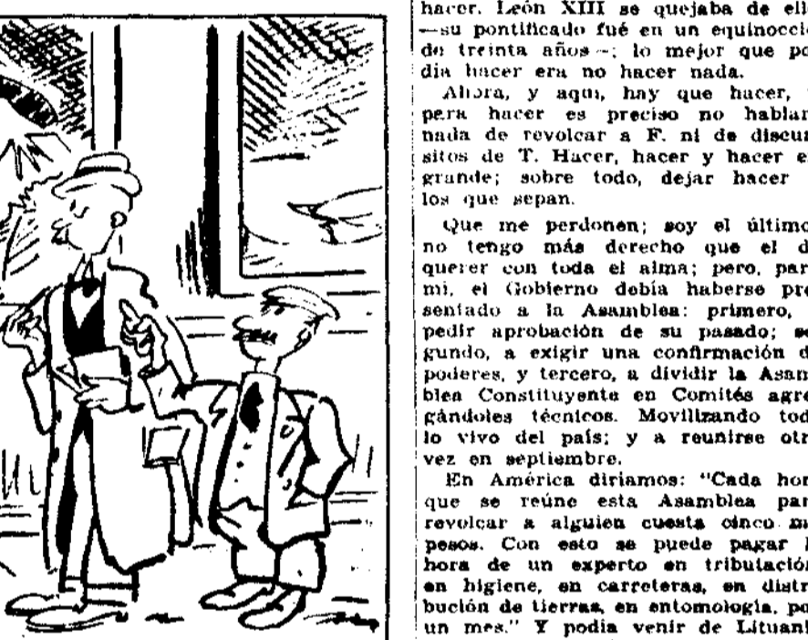
—Todo esto es de Goya, el genio castizo, al que le mató un toro, toreando con Pepe Hillo.