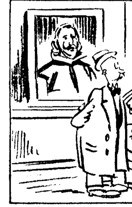
—Esto es de Velázquez, que abandonó la pintura al quedarse manco en la batalla de Lepanto.