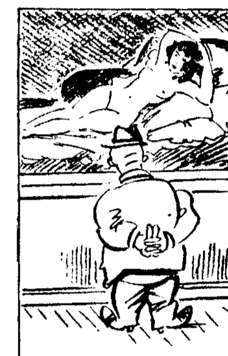
—Todo esto es de Goya, el genio castizo, al que le mató un toro, toreando con Pepe Hillo.