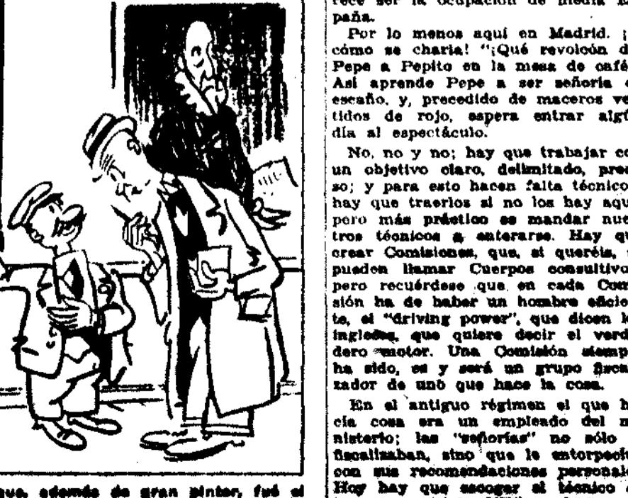
—Y aquí "He usó" al Greco, que, además de gran pintor, fué el inventor de la línea apocriofa.

compañía en la Comisión que, por lo menos, no le entorpezca. Hay que hacer en grande. Hay que dar a España la impresión cotidiana que se está construyendo un Estado moderno.