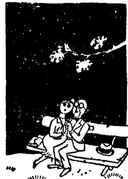
—Mira cómo reserva felizmente Marte su camino en el cielo... ¿Quién viviera allí!