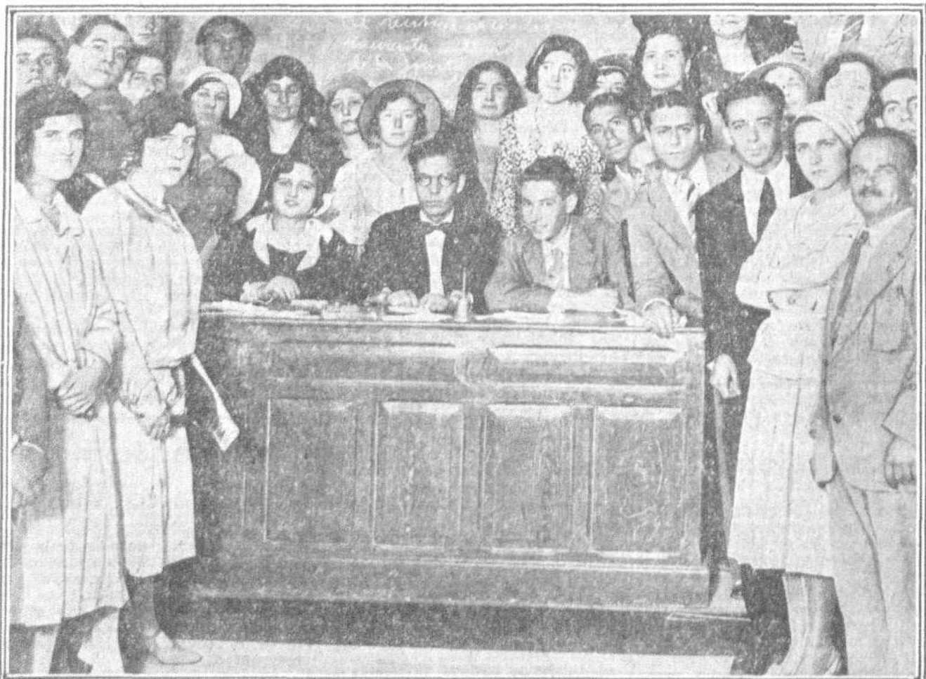
ASAMBLEA DE MAESTROS DE PRIMERA ENSEÑANZA.—Grupo de maestros reunidos hoy en asamblea en la Escuela Normal Central

El Consejo procedió a la designación de los delegados titulares en la Asamblea de la Sociedad de Naciones señores Briand, Flandin y Rollin. Se nombraron también tres delegados suplentes y seis adjuntos.—(Fabra.)