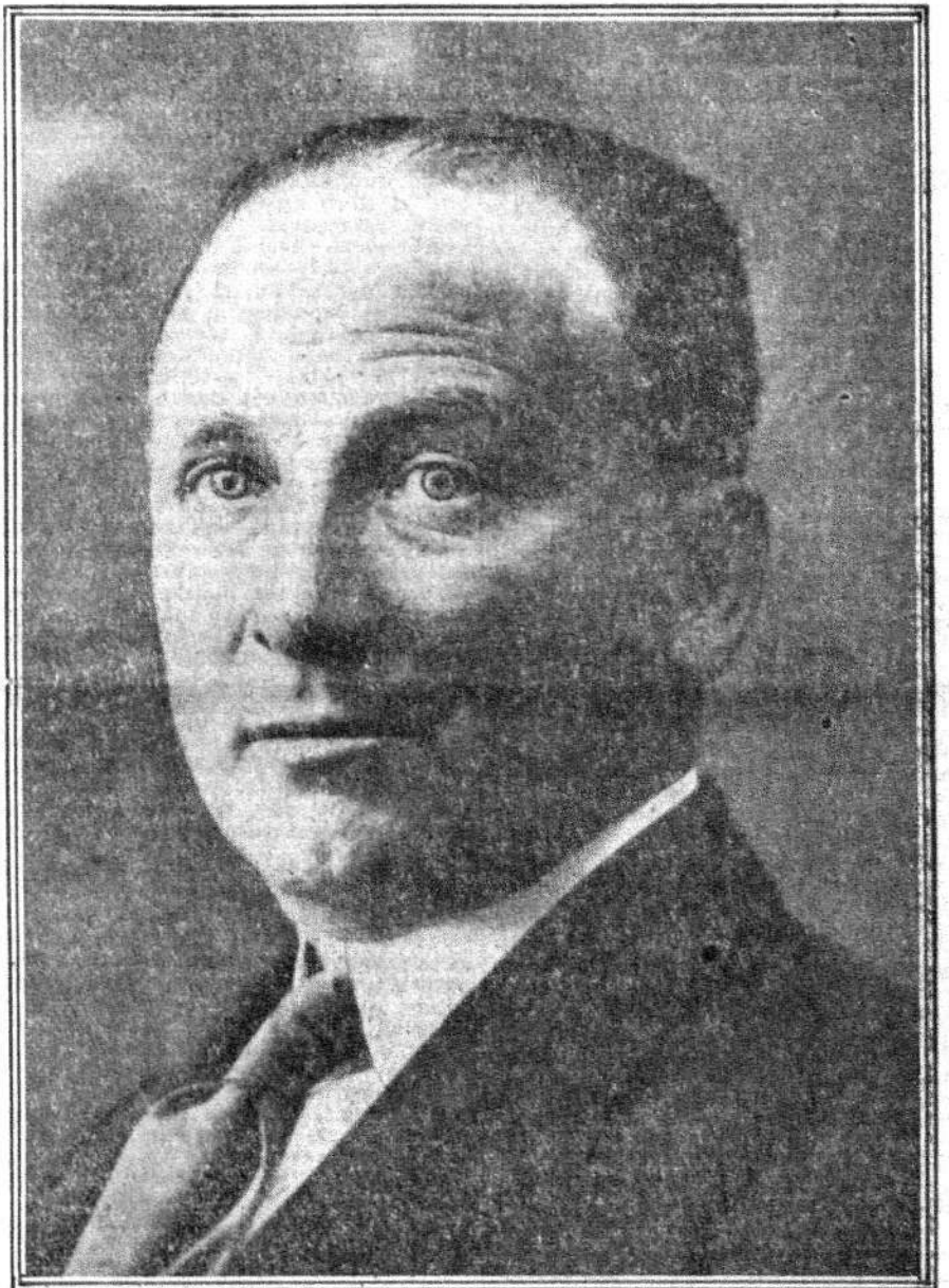
DON FRANCISCO LARGO CABALLERO

El Sr. Largo Caballero trabaja en las primeras horas de la mañana y de la tarde y en el silencio de la noche. Es cierto que recibe todos los días a muchas Comisiones, y que asiste a los Consejos y al Parlamento. Pero trabajar, lo que se dice trabajar, sólo puede hacerlo cuando la mayor parte de los españoles descansan. El ministerio de Trabajo adquiere cada día mayor significación. En estos momentos es el eje alrededor del cual gira la vida de España. El ministro ha de ocuparse todos los días a las ventanas del país para observar lo que pasa. Ha de tener mil ojos si quiere enterarse de todo y remediarlo en lo posible. El ministro no debe de estar muy abrumado, sin embargo, cuando todavía nos dedica unos minutos de charla. El ministro, este ministro obrero,