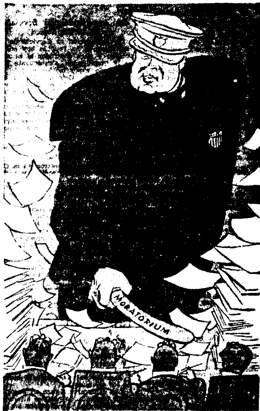
(De Gerhard Holler en "Der Wahre Jacob", de Berlín.)