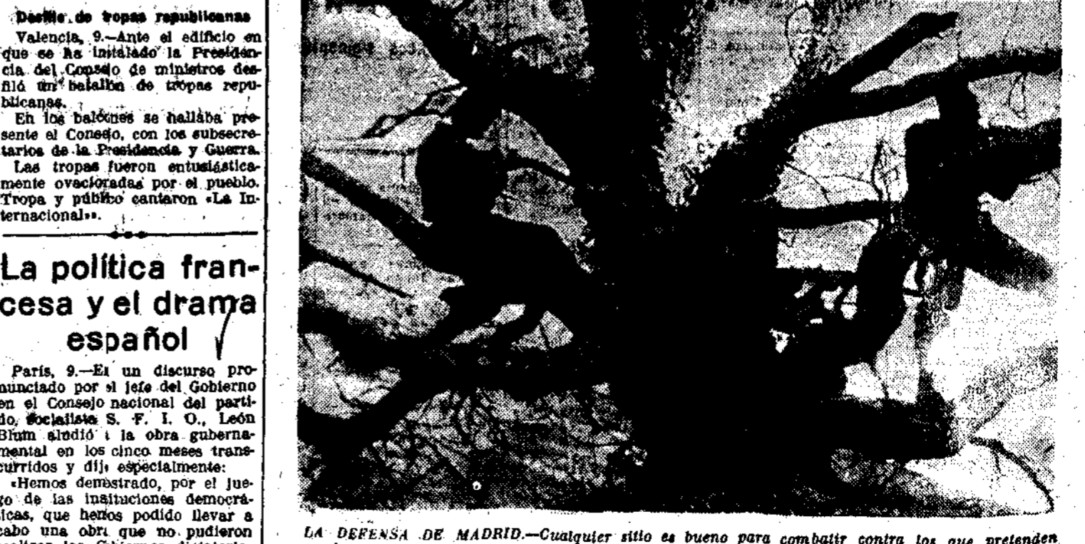
LA DEFENSA DE MADRID.—Cualquier sitio es bueno para combatir contra los que pretenden apoderarse de la capital; pero las copas de los árboles son magníficos parapetos para conseguir la retirada de las avanzadillas enemigas