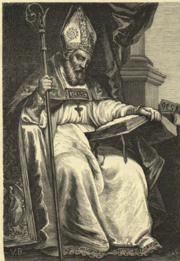
SAN ISIDORO, ARZOBISPO DE SEVILLA

gendran en el dócil corazon de los niños. Debía decirse, con razon, que todos los hombres que hacian alarde