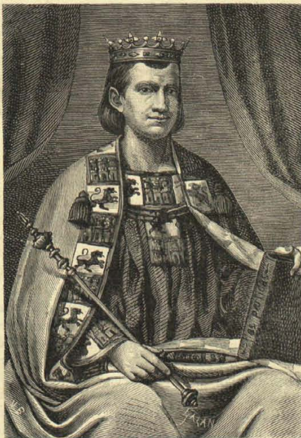
DON ALFONSO EL SABIO