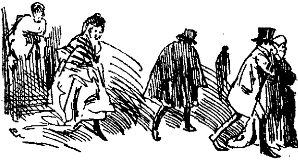
¡A casa, á casa, á casa! ¡Suenan tiros.