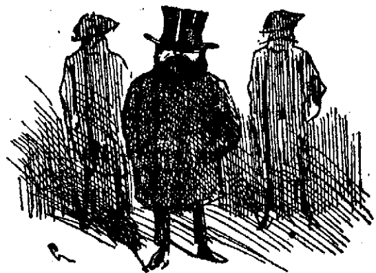
¡Yo solo, con un par de guardias, me hazto y me sobro!