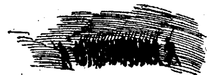
Orden completo.—Dos reales por plaza todos los dias.