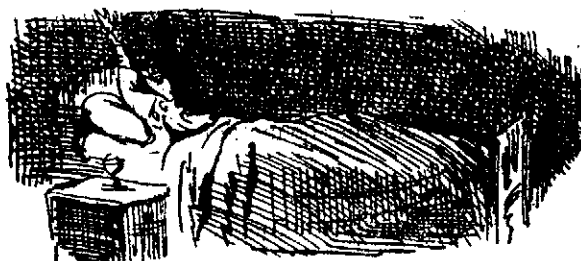
El gobernador... mata el sueño.