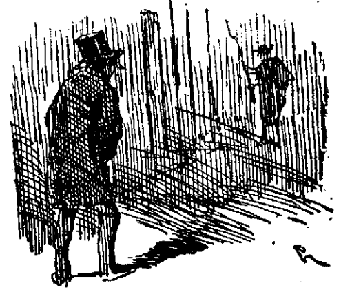
¡Quién vive!—¡No vivo que soy cesante!