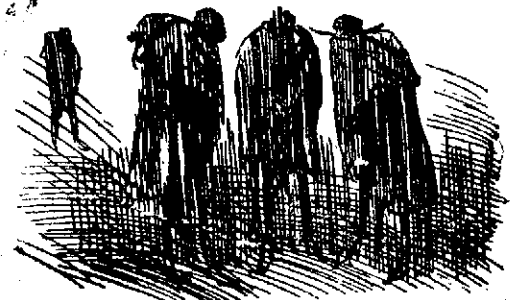
¡¡Que no quede uno vivo!