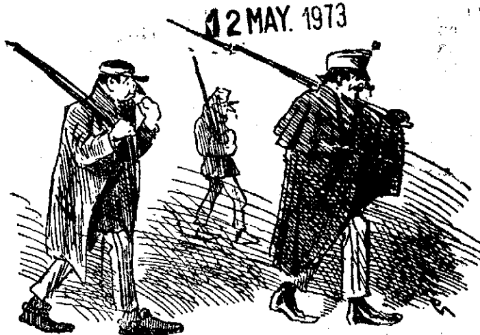
¡Valiente noche para ir de bureo!