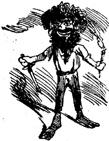
¡Salud y petróleo!