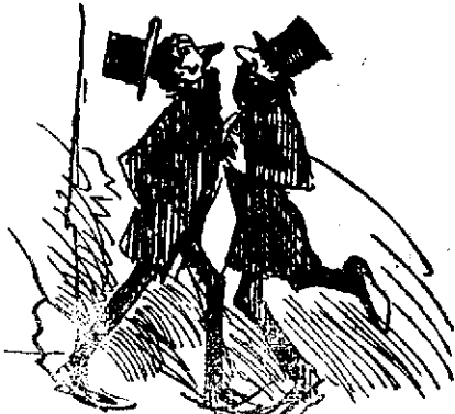
Al doblar una esquina.