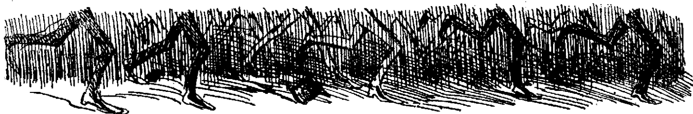
Aspecto general de la poblacion, en cuanto suenan las nueve de la noche.