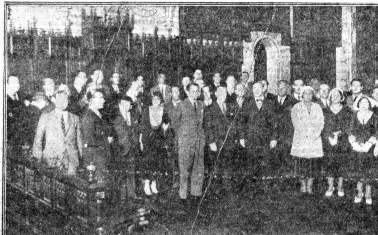
CONGRESO HISPANOAMERICANO DE CINEMATOGRAFIA EN BARCELONA.—Sesión de inauguración en el Salón de Ciento del Ayuntamiento, con asistencia del alcalde

CRISOL cuesta 15 céntimos. El precio es la garantía de su independencia.