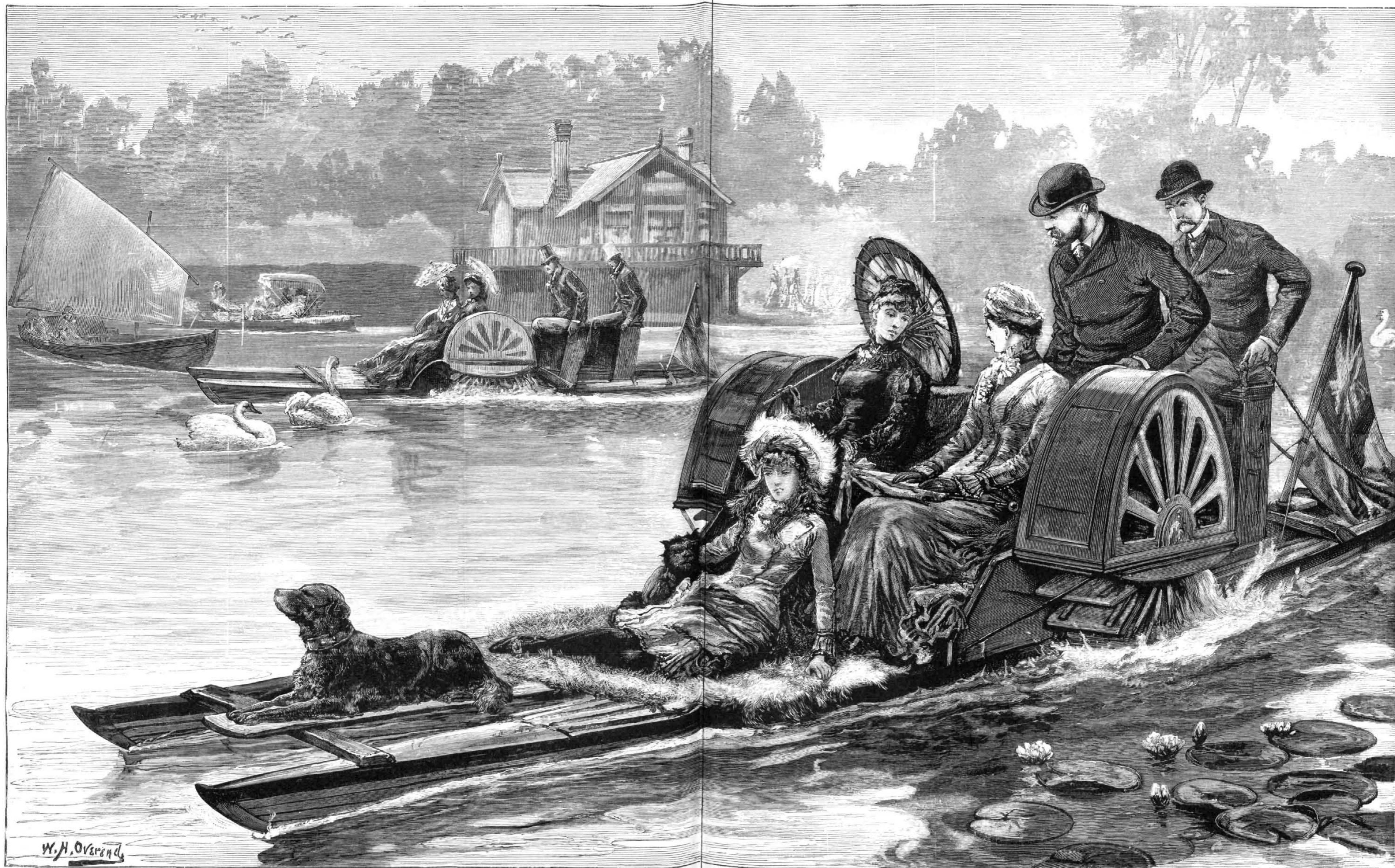
UN PASEO POR EL LAGO DEL PARQUE DE WINDSOR (POR W. H. OVEREND)