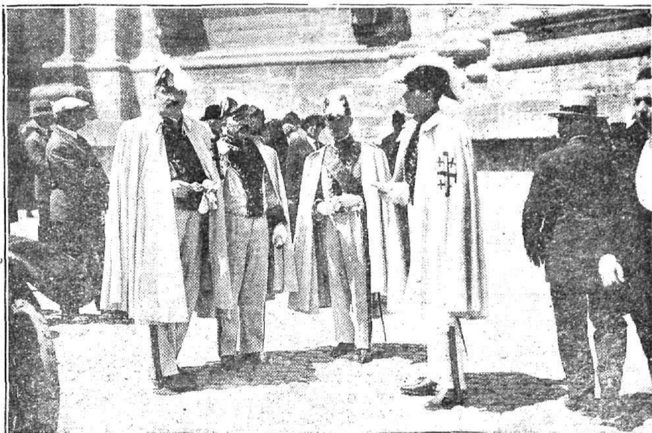
Un grupo de caballeros del Santo Sepulcro a la puerta de la Basílica de San Pedro, con motivo de las peregrinaciones.