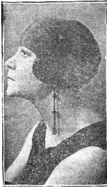
La notable pintora Maroussia Valero.

Se da el caso frecuente que la mujer destaque con personalidad propia en carreras científicas, literarias y en aquellas otras artes u oficios que son apropiados a su temperamento y sexo; pero en contadas excepciones se suelen revelar como pintores y escultores de primer orden. Por eso las obras que expone en el elegante Salón Easo la pintora Maroussia Valero merecen ser encomiadas, porque demuestran un temperamento de artista digno de aprecio, a la cual sólo falta un poco de serenidad para llegar a realizar en una forma más sintética aquello que es preciso den-