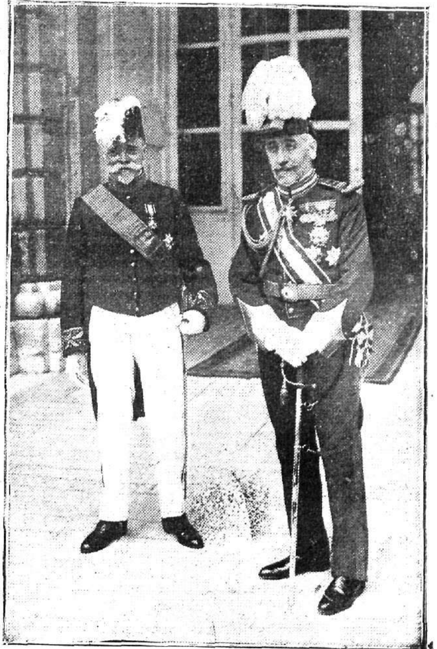
El señor Pleyt, nuevo ministro, al salir esta mañana de Palacio, después de presentar sus credenciales al Rey.