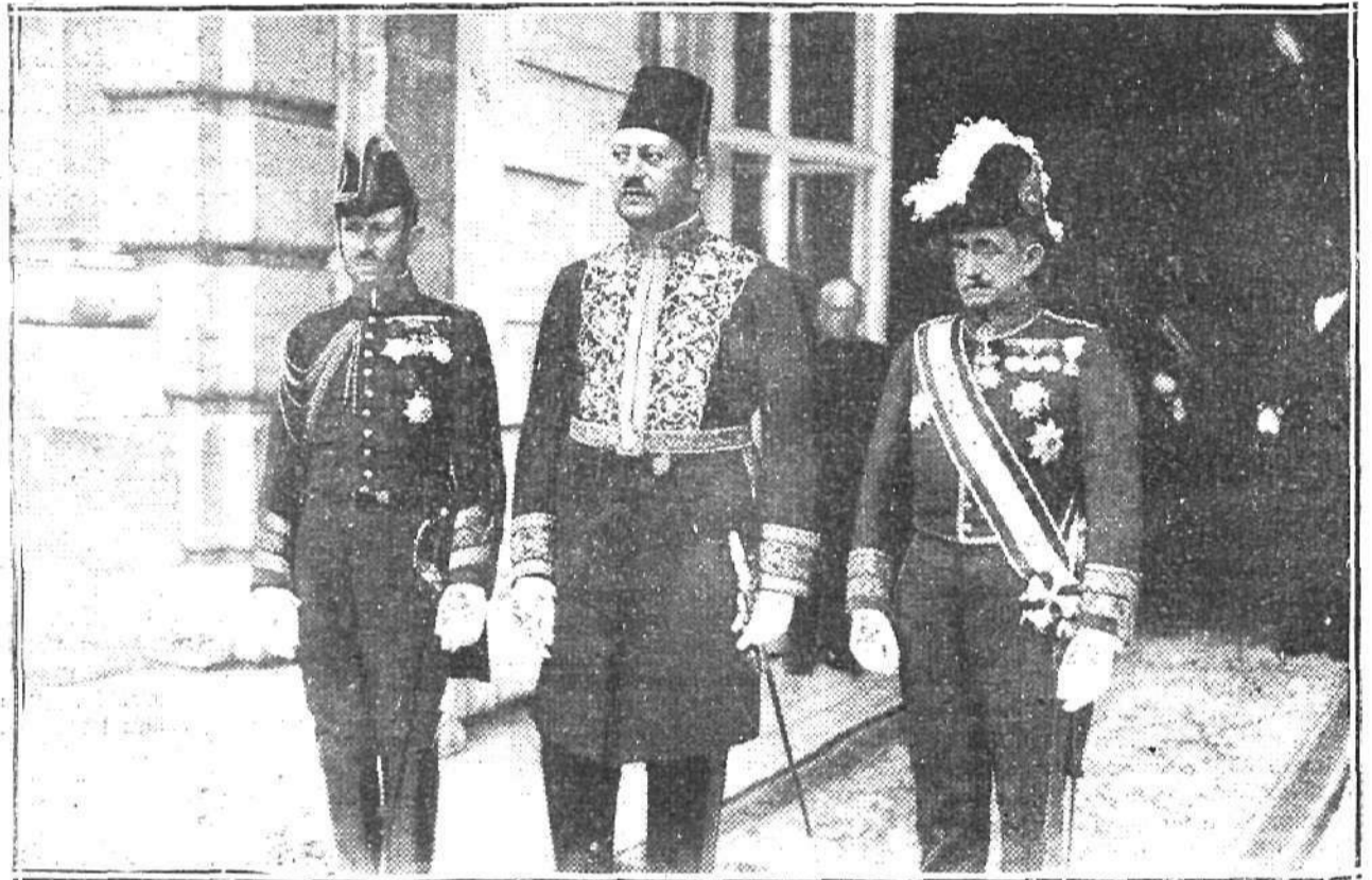
Sadik-Henem-Bajá, nuevo ministro de Egipto, al salir esta mañana de Palacio después de presentar sus credenciales al Rey.