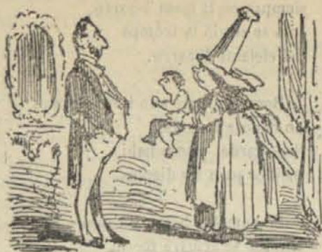
Allende del Pirineo nació un gabacho muy feo