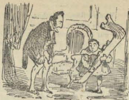
Adivinando su fin le dan por nombre Cain.