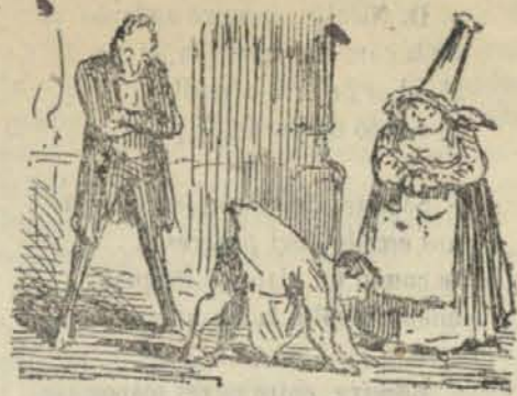
Al año y mucho de pues aun andaba en cuatro piés.