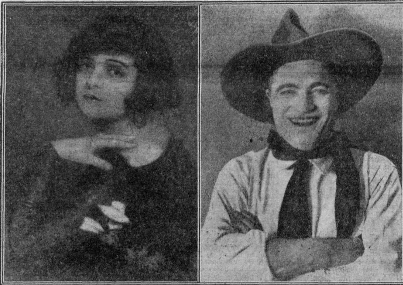
Lya de Putti y Tom Mix, los dos grandes artistas de cine, muerta hoy la primera y gravemente enfermo él en Hollywood

Hoy se ha verificado en el cementerio de Guecho el entierro.—(Fulmen.)