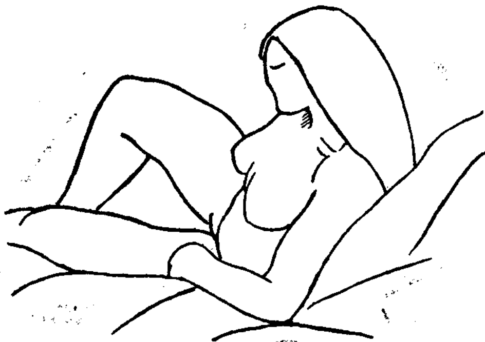
(Dibujo de Eva Aggerholm.)