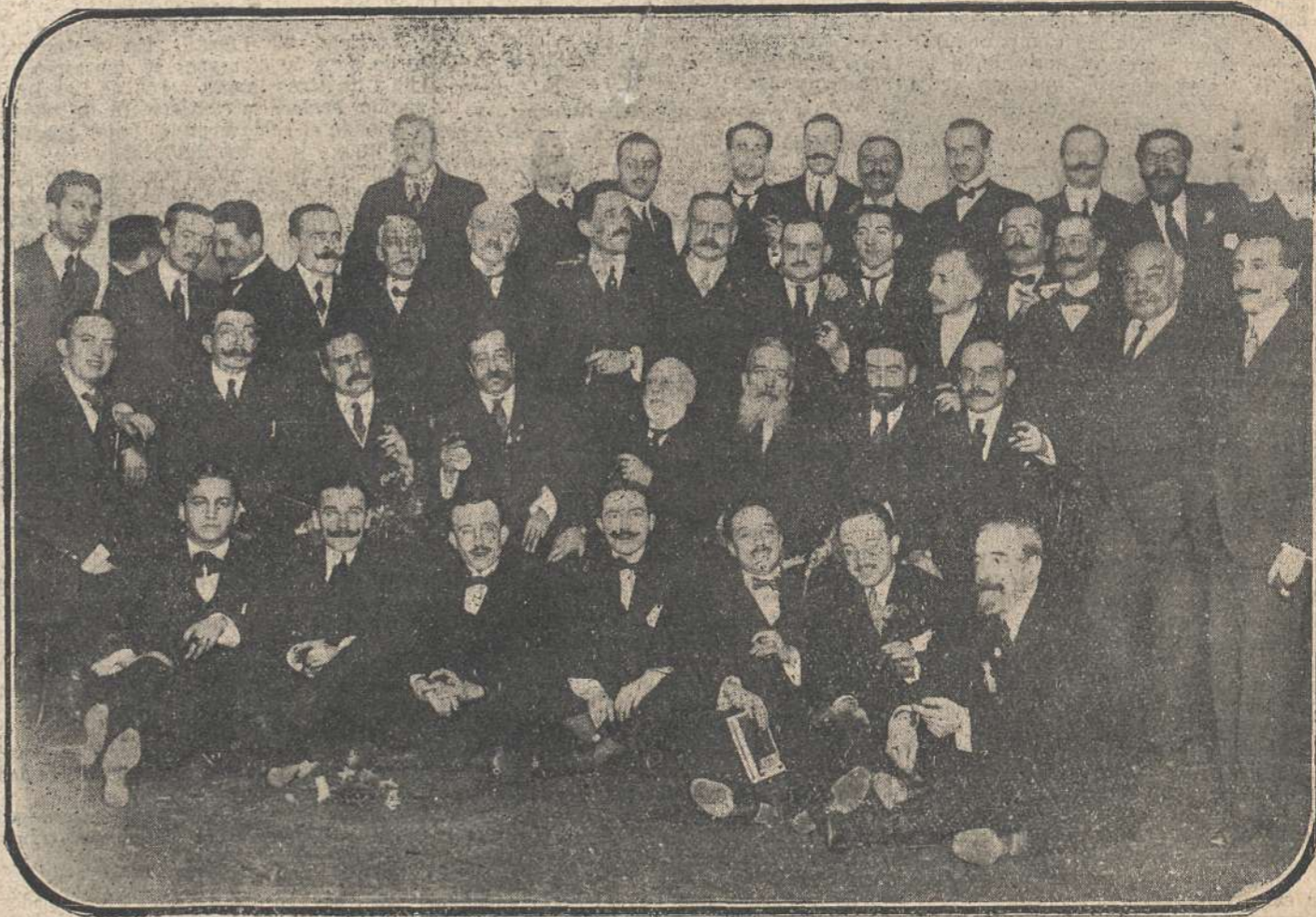
Algunos de los periodistas que hacen información en el Congreso, reunidos esta tarde en un fraternal almuerzo para celebrar la terminación del año.

prevé la esclavitud económica, porque el país sólo puede oponerse por la revolución. Pero ésta requiere hombres y no los hay, porque hasta los de cuarenta y cinco años están en el frente, y así se explica que sólo tengamos noticias de algunos obispos como los de Arzobispo y de los talleres de Pullow, que delatan la hoguera latente que tiende a la expansión.