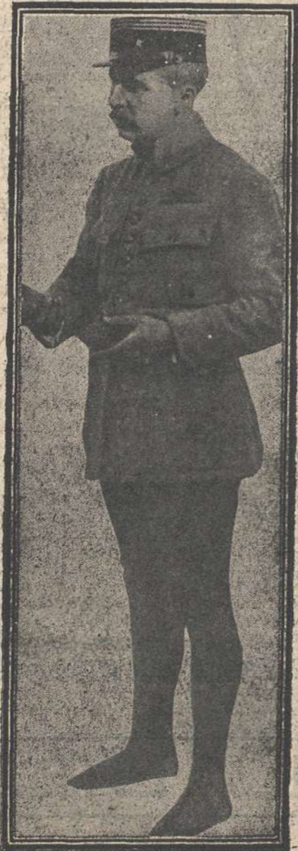
El famoso aviador francés M. Beauchamp, que tan grandes servicios ha prestado a su país en la actual campaña, fallecido anteayer.