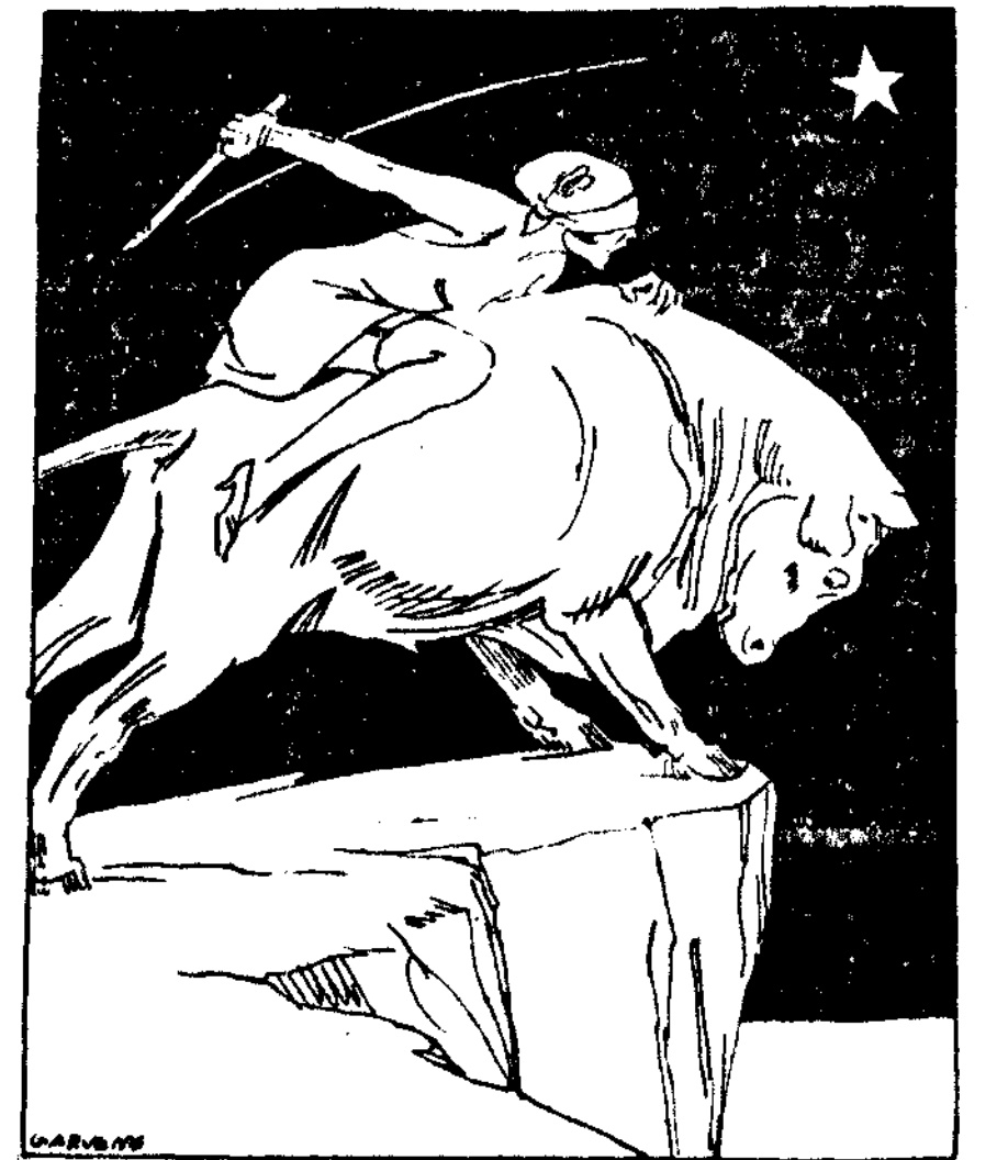
EUROPA (De Garvens en "Kladderadafsch".)