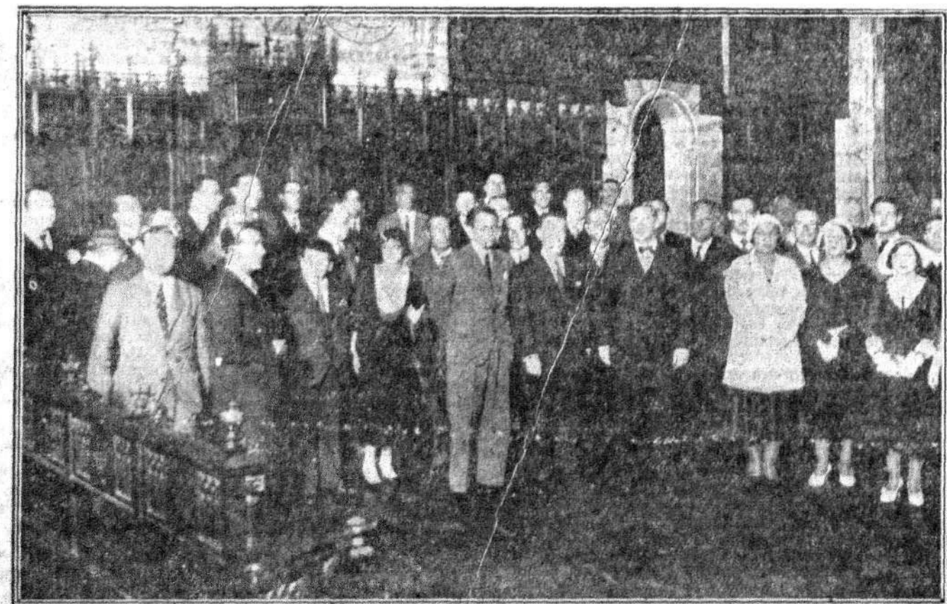
CONGRESO HISPANOAMERICANO DE CINEMATOGRAFIA EN BARCELONA.—Sesión de inauguración en el Salón de Ciento del Ayuntamiento, con asistencia del alcalde

CRISOL cuesta 15 céntimos. El precio es la garantía de su independencia.