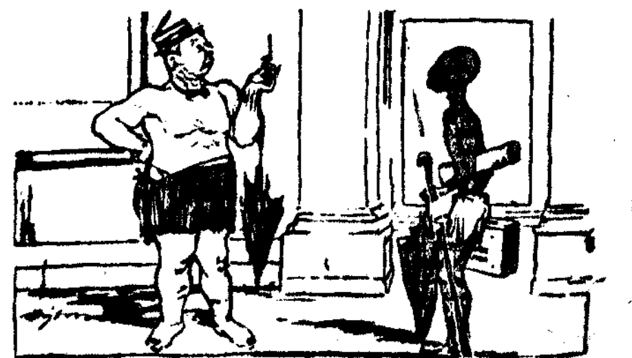
El contribuyente inglés.—¡Hombre! ¡Tú también has topado con Snowden! (De Will Dyson en "Daily Herald".)