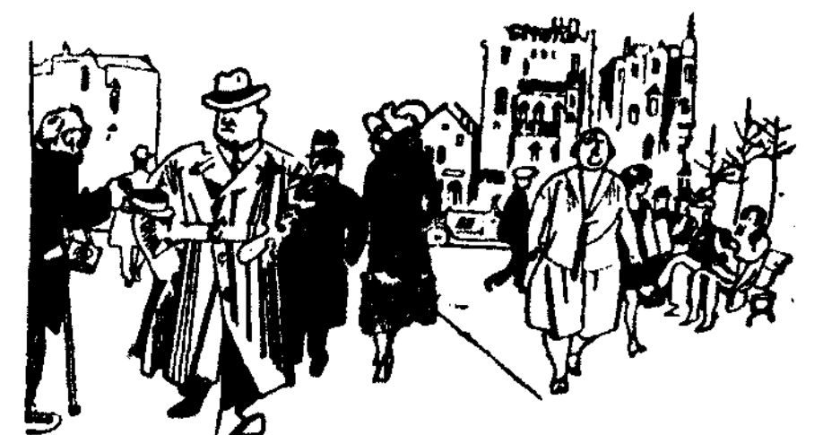
El encuentro.—Buenos días, señor director. —¿Es que me conoce usted? —¡Va lo creo! ¡Me he dejado todo mi dinero en su casa! (De Karl Hoitz en "Der Wahre Jacob", de Berlín.)