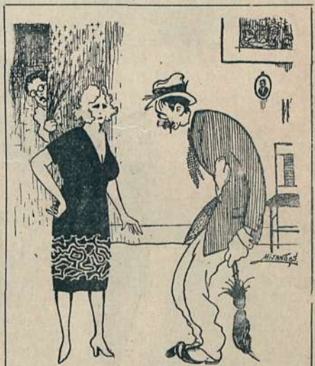
DEL MAL EL MENOS Dib. de MIJANGOS.

—¿No te parece, Manolo, que este trajecito va a llamar un poquito la atención?