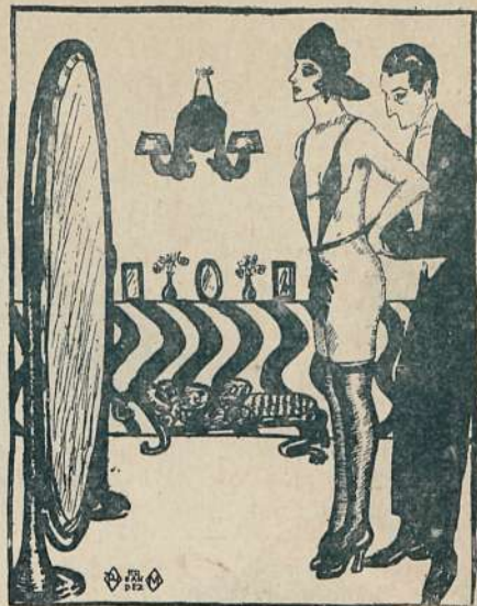
LAS NUEVAS MODAS Dib. de HERNÁNDEZ.

—Se habla, puesto que «ningún varón puede allegarse