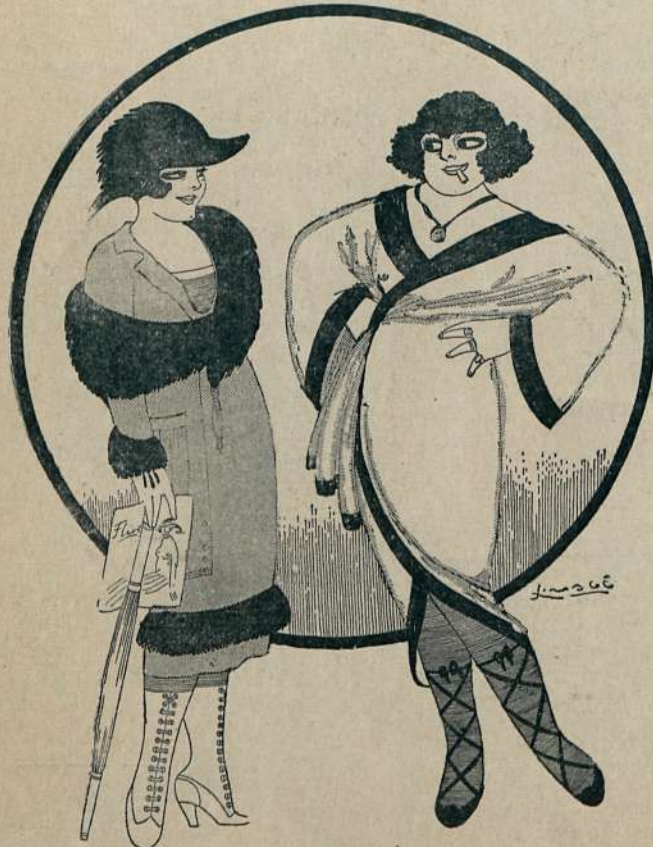
—Me viste el Marqués. —¿Pues no decías que el Barón? —No hija, jese me desnuda!