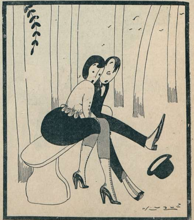
—¡¡Que viene el guarda!!