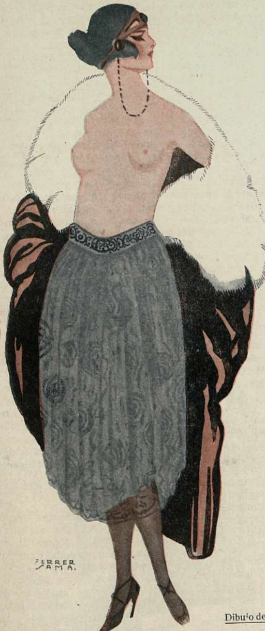
Dibujó de FERRER SAMA