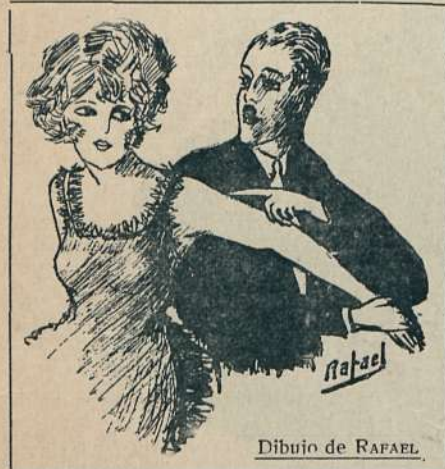
Dibujo de RAFAEL.

LA MODELO. —No quiero que me pintes la cara; me conocerían los amigos de mi marido. EL PINTOR. —Por el resto del cuerpo te conocerán lo mismo.