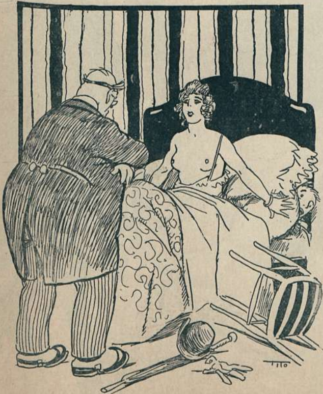
INFRAGANTI. —¡Basta, señora! ¡Jamás la creí capaz de afrontar una situación a pecho descubierto!