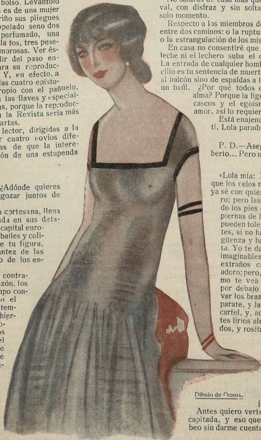
Dibujo de OCHOA.

P. D.—Se dice que un tal Rodríguez te... Pero no lo creo.»