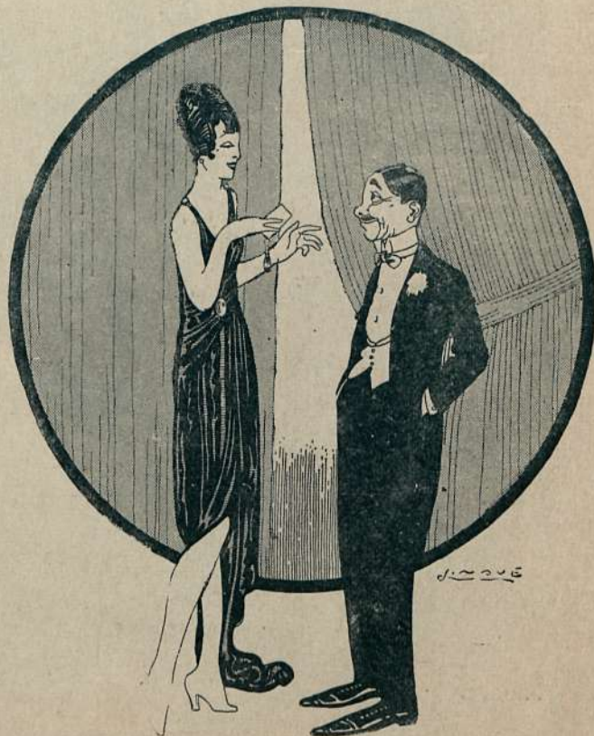
—Sí, Marquesa, a mi hermana y a mí nos corresponden varias partes del capital, pero solamente entre mis partes tengo yo una fortuna.