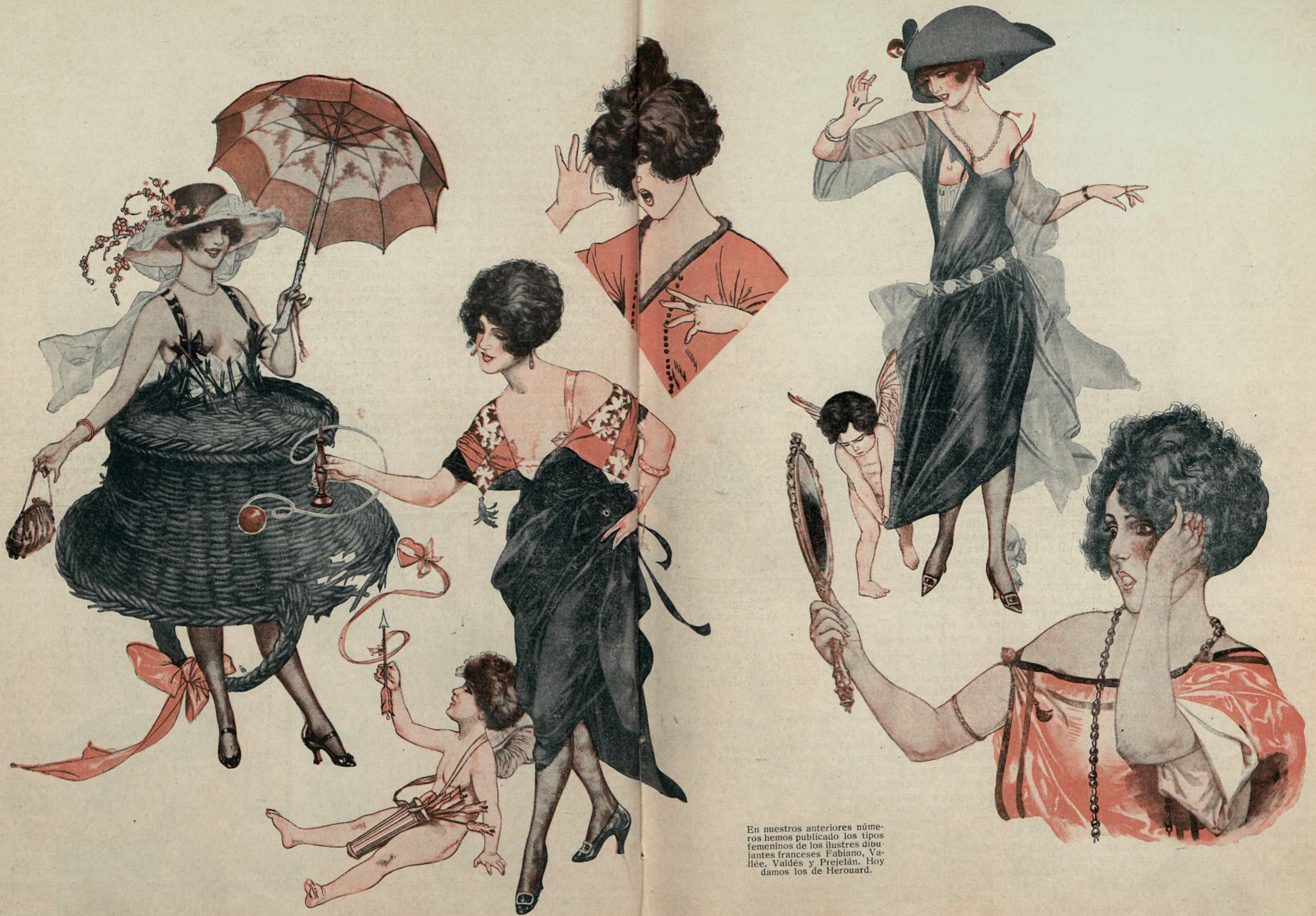
En nuestros anteriores números hemos publicado los tipos femeninos de los ilustres dibujantes franceses Fabiano, Vallée, Valdés y Prejelán. Hoy damos los de Herouard.