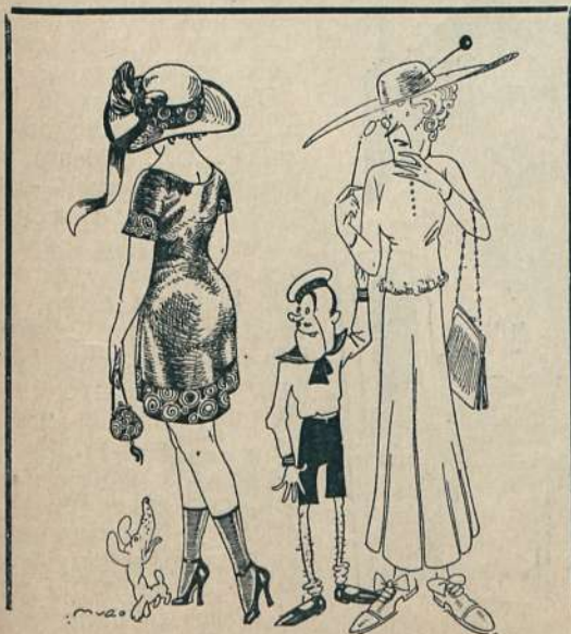
LA SEÑORA CURSI

—¡Parece mentira; yo no tendría valor para salir tan desnuda!