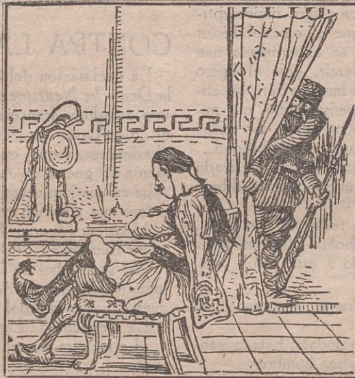
—¿Quién entra? —El enemigo hereditario. —Está bien; pase ó instállese.