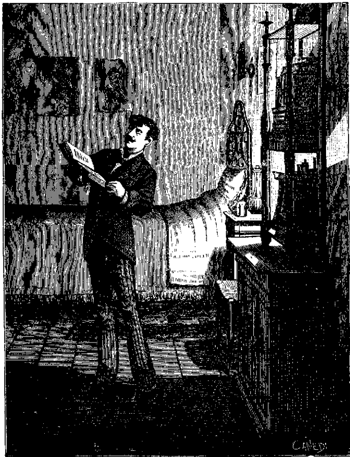
1.—...vió escrita en la portada una dedicatoria de la difunta madre...

Compónese este renombrado edificio de un entresuelo y tres pisos. Las galerías del primero y del segundo están adornadas de balcones de mármol blanco y ventanas de ese estilo mitad sarraceno y mitad gótico, cuyo feliz conjunto apenas se ve más que en Venecia. El aspecto general es imponente: