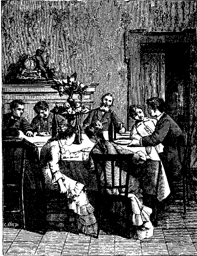
3.—¿Era también médica la Cenicienta?—preguntó de pronto Manolito

Este país, tiene razón Taboada, no es el de los segovianos que