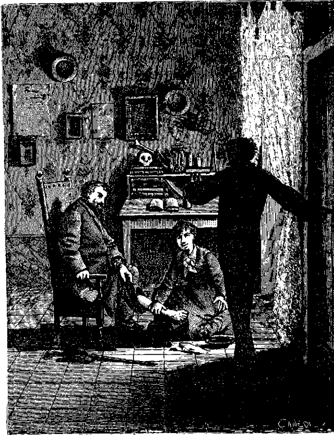
5.—...al ver á María que estaba sustituyendo á su papá...

este general apostado con sus tropas en las gargantas del Vierzo, estableciendo su cuartel general en Villafranca. No se sabe en qué razones se apoyaban los asesinos; pero lo cierto es que fué asesinado en las calles de aquella villa por unos voluntarios del batallón de La Coruña que habían venido á incorpo-