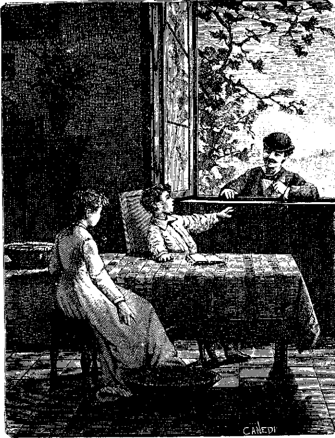
6. —Pero ¿no le ayuda nunca nad'e a la señorita María?

Por la noche destinósele por habitación el cuarto de María, la cual se avi-