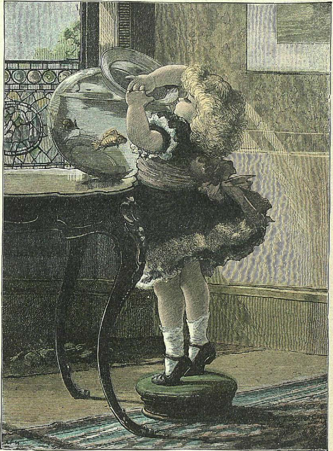
PESCA A DOMICILIO