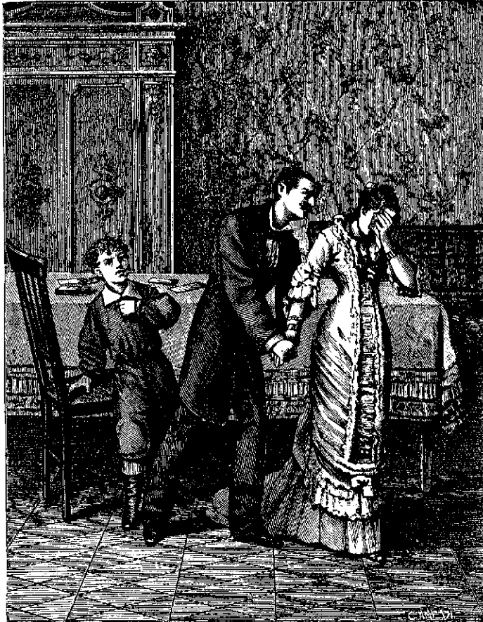
7.—... suéltale una declaración por todo lo alto...

Convenido está, la joven se dirigió á la iglesia, descolgó el cuadro y llevólo á su casa. Todas sus amigas reconocieron bien que era el mismo cuadro de que