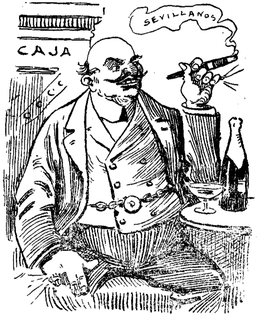
—Yo sevillané en grande.

que preocuparnos de que la carne esté cara; es esta una cuestión que no tardará en desaparecer, porque, ¿qué nos importa que esté cara ó barata?