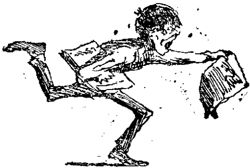
EL AÑO NUEVO.

Todo el que quiera suscribirse al notabilísimo periódico La Ilustración Española y Americana , que es sin disputa el más notable que se publica en España, por sus excelentes artículos y hermosos grabados, debidos á los primeros artistas, puede remitir el importe de la suscripción á esta administración. Estamos autorizados por la empresa de La Ilustración para admitir suscripciones. Lo mismo decimos á las señoras que se quieran suscribir á La Moda Elegante Ilustrada , periódico imprescindible á toda mujer de buen gusto.