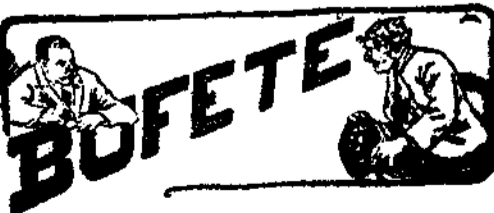
Desde El Toboso.

Los extremos se tocan: Romanones, en fuerza de no tomar medida alguna, fué sorprendido por la bomba de Morral; La Cierva, en fuerza de tomar tantas, tan inconsideradas y tan fuera de tino, se va á encontrar sorprendido con alguna protesta que le arroje del ministerio más desacreditado que Romanones.