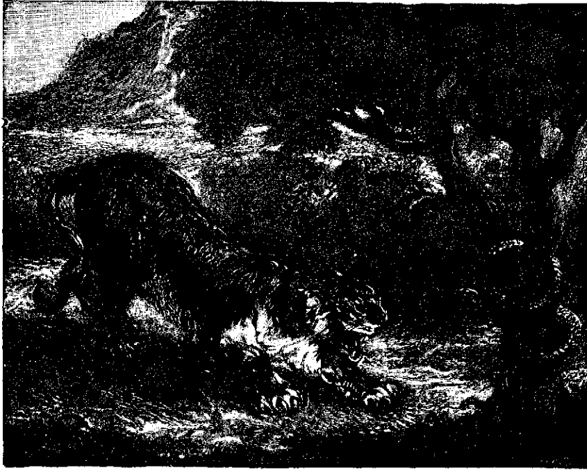
El tigre y el naja

Al contrario, apenas amaneció el siguiente día, fué al paseo del Lago, no menos distante de la granja que el campo de la Encina. Como el día anterior, reconoció detenidamente el terreno, sin que encontrara en él caballo alguno. Lo que sí le sorprendió fué un colosal oso blanco, cuya descomunal y abierta boca semejaba la negra garganta de profundo abismo. Ante aquella inesperada aparición, Gaspar vaciló unos momentos; pero, adivinando que no