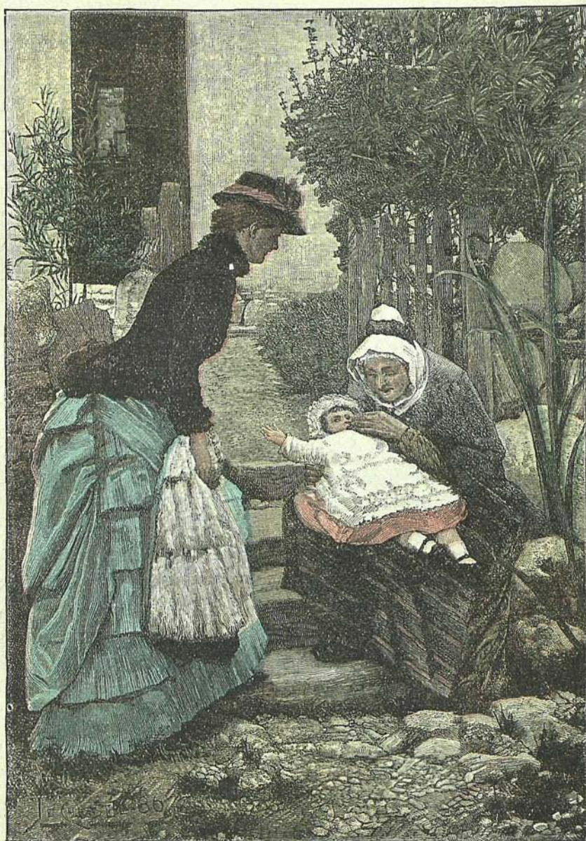
ENTRE MAMÁ Y LA ABUELITA