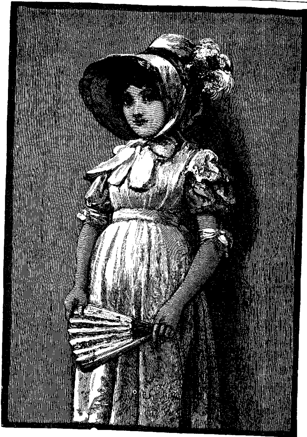
Doncellita de la época del Directorio