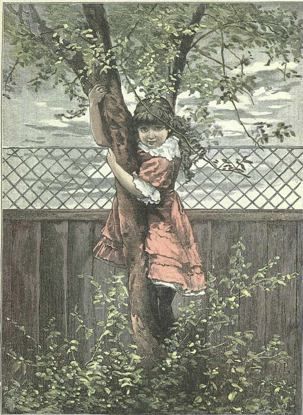
GIMNÁSTICA AL NATURAL