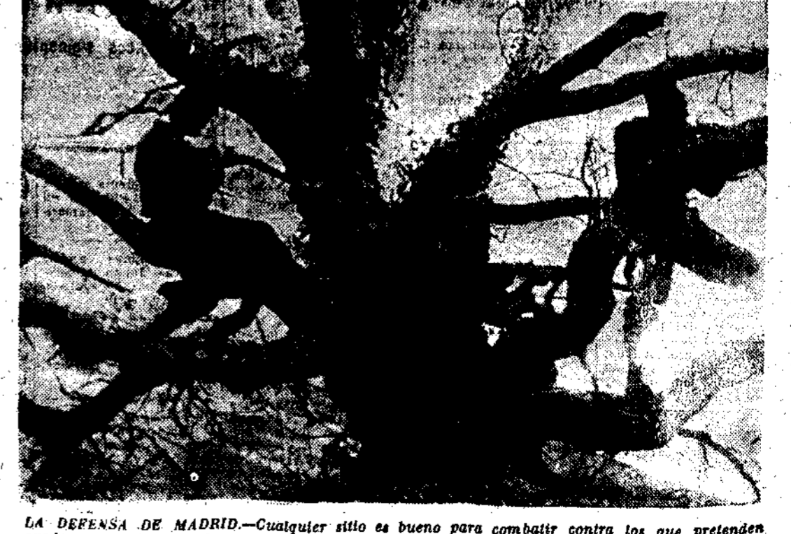
LA DEFENSA DE MADRID.—Cualquier sitio es bueno para combatir contra los que pretenden apoderarse de la capital; pero las copas de los árboles son magníficos parapetos para conseguir la retirada de las avanzadillas enemigas

París, 9.—En un discurso pronunciado por el jefe del Gobierno en el Consejo nacional del partido socialista S. F. I. O., León Blum aludió a la obra gubernamental en los cinco meses transcurridos y dijo, especialmente: «Hemos demostrado, por el juego de las instituciones democráticas, que hemos podido llevar a cabo una obra que no pudieron realizar los Gobiernos dictatoriales.»