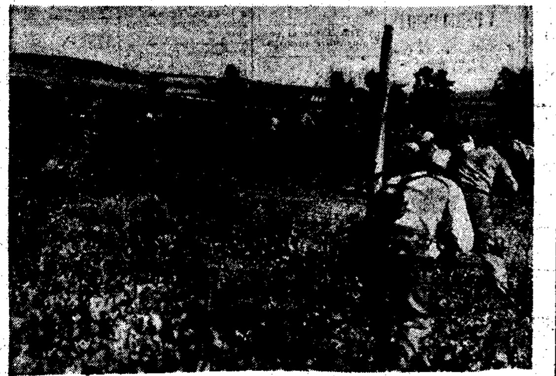
LA DEFENSA DE MADRID.—Una exploración del terreno por nuestros milicianos

Terminado el Consejo, quedaron reunidos los componentes del Consejo Superior de Guerra, durante la reunión hasta las ocho y cuarto. A la salida no hicieron manifestación alguna.