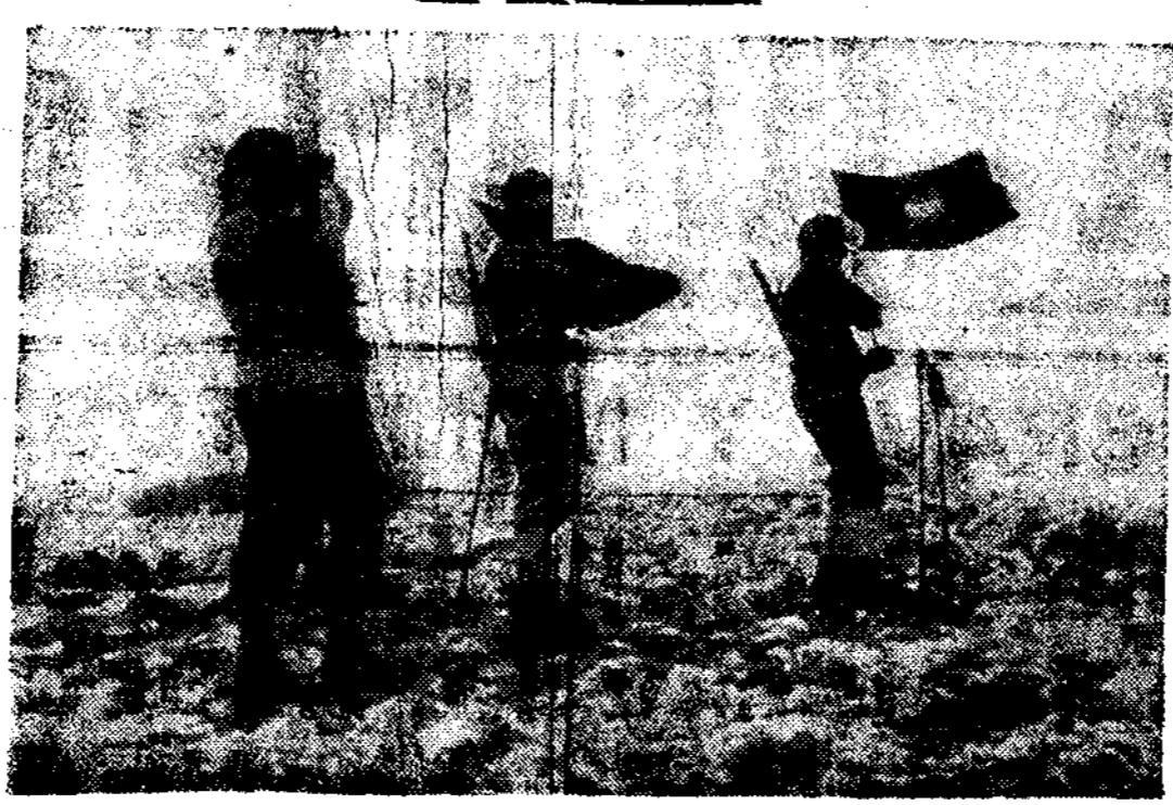
LA GUERRA EN LA SIERRA.—Nuestros soldados, entre la nieve, comunican con los compañeros de la retaguardia

Nuestras posiciones del sur de la capital han sido fortificadas de modo insuperable.