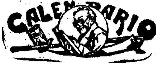
95 semana maurista.