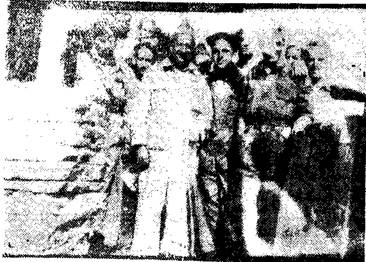
El heroico teniente coronel Del Rosal, jefe de la columna que operó en el sector derecho de Somosierra, acompañado de su Estado Mayor y de nuestro compañero Guzmán

Después del bombardeo, hecho sin importancia por ser el pan de cada día, ha vuelto la calma, la más absoluta calma. Hasta en los parapetos ha cesado el tiroteo. Preguntamos y nos contestan: --El enemigo va careciendo de municiones. En vista de ello, la calma no va con el espíritu del cronista; marchamos.