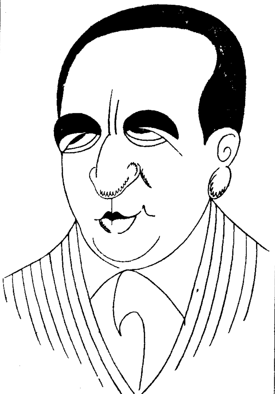
DON ANDRES MORENO, visto por Bagaría.

España no puede menos de sentir los chispazos de este drama, pero quizás nuestro mercado, por su aislamiento, lo resista mejor que otros. Este es el momento psicológico para que nosotros mismos seamos quienes defendamos nuestra industria y nuestro comercio, provocando un total resurgir de la economía nacional. Todos deberían contribuir a ello. ¡Atrinchérense en sanos principios políticos y utilicemos como munições nuestros propios recursos, los atesorados y los exportados! Es precisamente en estos momentos de crisis cuando la fe patriótica se desarrolla con más intensidad en los países verdaderamente sanos. ¿Tengamos fe en nosotros mismos! Nuestro dinero corre fuera aún más riesgos que dentro. ¡Seamos, pues, prudentes y reagrupémonos en defensa de lo que es de todos!