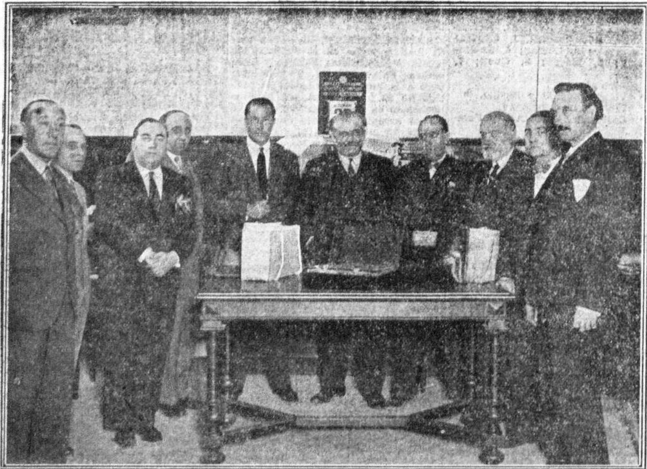
EN EL CONGRESO.—José Antonio Primo de Rivera ante la Comisión de Responsabilidades, examinando los documentos de su padre