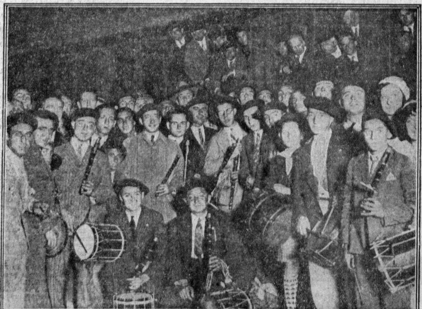
LLEGADA DE LOS ALCALDES VASCOS A MADRID PARA HACER ENTREGA HOY AL GOBIERNO DEL ESTATUTO VASCO

En la reunión todos los estamentos demostraron la capacidad de nuestro pueblo para el propio gobierno. He de felicitar a cuantos se reunieron, y es de agradecer su deseo de concordia, de paz y de disciplina. Los parlamentarios, por su intervención en la defensa de sus puntos de vista y por su comprensión verdaderamente patriótica para llegar a una solución, merecen, asimismo, ser felicitados, y el presidente de la Generalidad, que dió muestras constantes de sacrificio y abnegación en pro de la paz de una tierra que tanto estima y que tan dignamente representa, también merece todas mis felicitaciones. Es de esperar, pues, que se imponga siempre el buen sentido tradicional de Cataluña, y en él confío en estas circunstancias, porque sin la colaboración de todos los estamentos para la consolidación de la República y la prosperidad de todo el territorio de Cataluña y España, poco puede hacer la autoridad gubernativa, que ha de tener la ayuda de todos los ciudadanos. Es de creer que se imponga el buen sentido, repito, y que queden resueltos los conflictos, dejando abierta la vía del derecho antes de que los problemas se agudicen y constituyan una amenaza para la riqueza de Cataluña.—(Fulmen.)