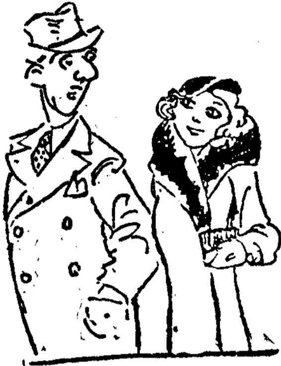
—¿Me has tomado por un perfecto idiota? —No, hijo; la perfección no es de este mundo. (De «Aftenposten», Oslo.)