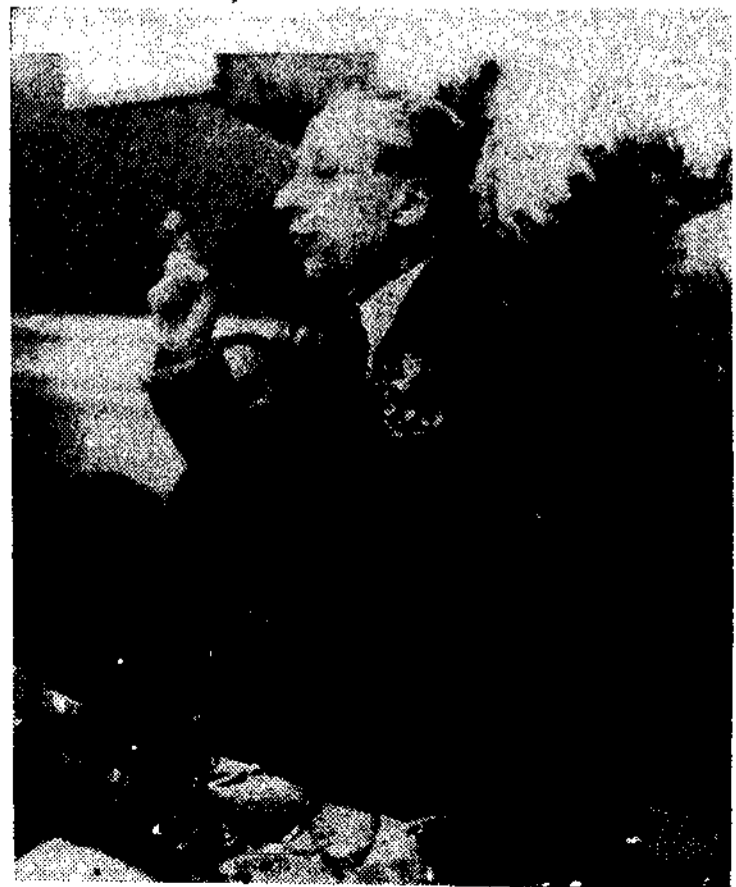
Don Alvaro de Albornoz en uno de los párrafos de su magnífico brindis, dedicado, como el de todos los que concurrieron a la inolvidable fiesta de ayer, a la unión de las fuerzas democráticas y al servicio de España y de la República

Los frutos ya se han visto: la unión de los republicanos no es que esté en marcha, sino que es una realidad, así como la unión de los republicanos con las fuerzas obreras, y esto nos hace esperar que para el próximo año hemos de cosechar la herencia de éste que muere, y no con el sentimiento que a la muerte habría de acompañar, porque parece que la muerte de este año es como la de