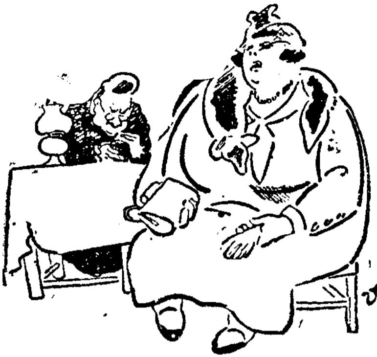
La eschadora de cartas... y su alma delicada y sensible, aspira a un poco de poesía... (De «Humoristicke Listy», Praga.)