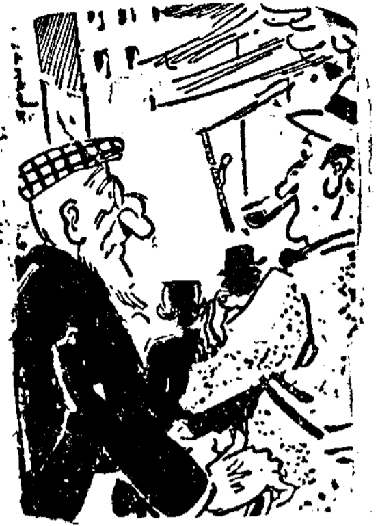
El anciano.—¡Ah! En mis tiempos los incendios eran mucho mejores. (De «Smith's Weekly», Sydney.)