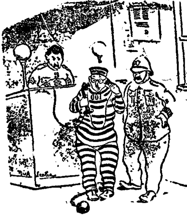
—Que he perdido la invitación del baile de máscaras, y los agentes no me quieren creer. (De «Everybody's», Londres.)