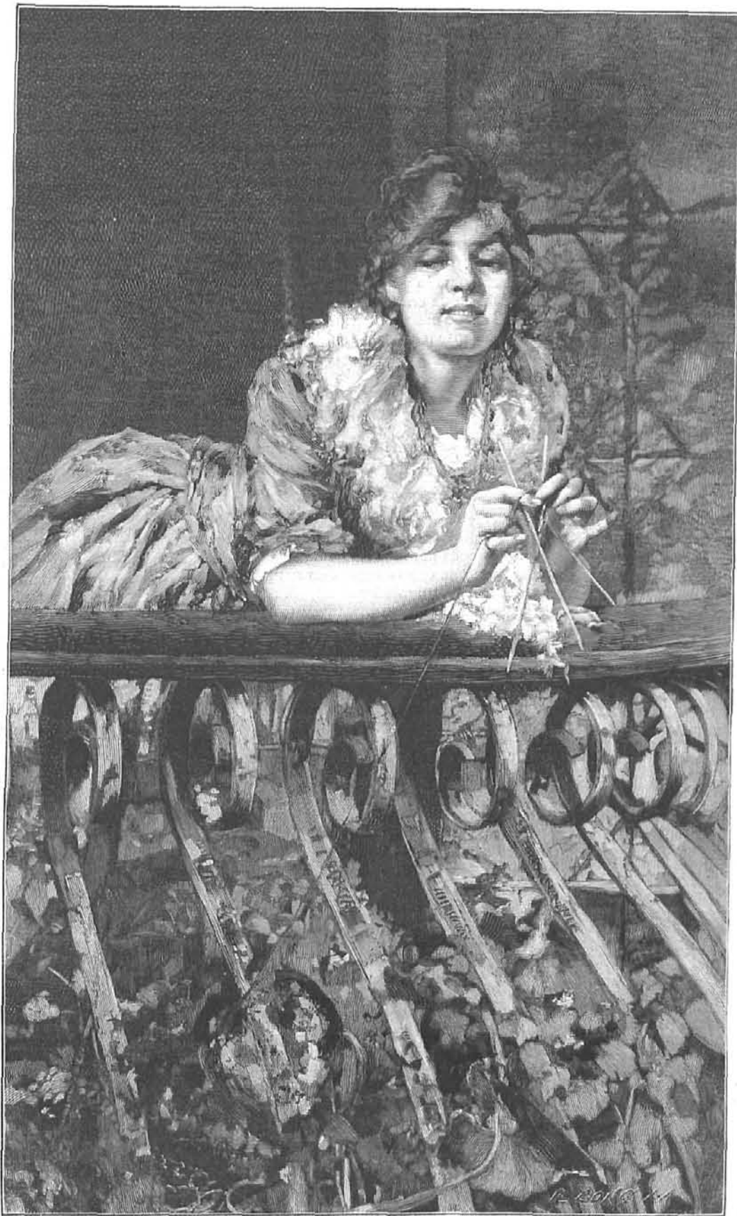
EN EL BALCÓN, cuadro de Lancerotto, grabado por Baude

REGALO Á LOS SEÑORES SUSCRITORES DE LA BIBLIOTECA UNIVERSAL ILUSTRADA