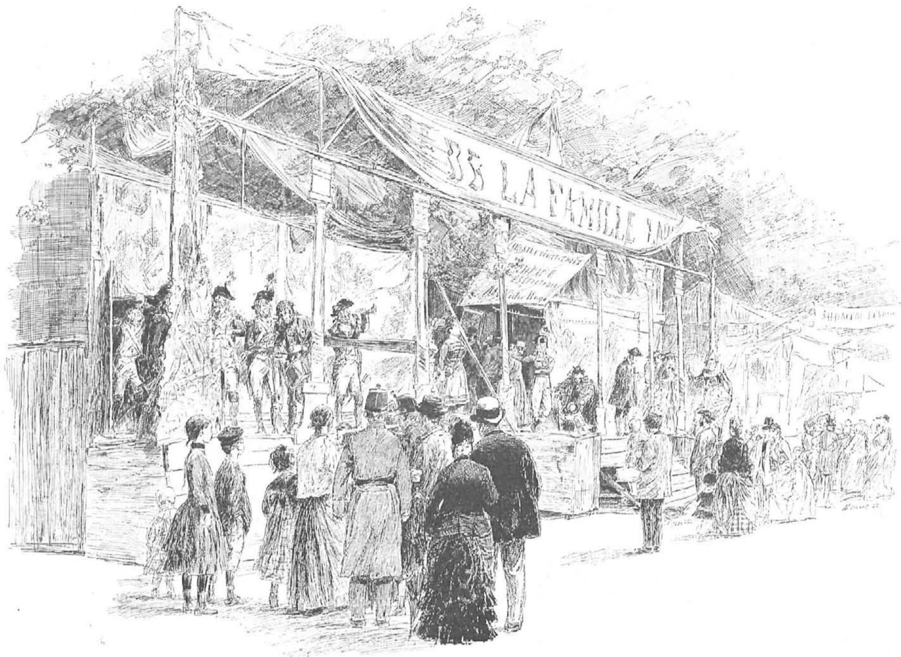
EN LA FERIA DEL «PAIN D'ÉPICE», PARÍS. - Dibujo de Vogel