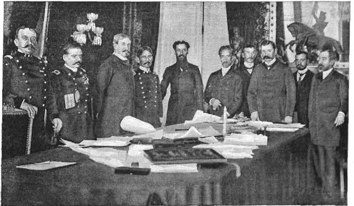
LA COMISIÓN ARGENTINO-BRASILEÑA QUE HA CONVENIDO EL TRATADO DE MONTEVIDEO RELATIVO AL TERRITORIO DE LAS MISIONES