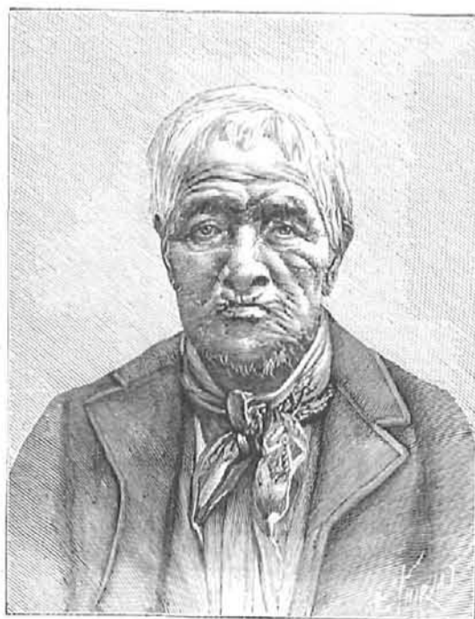
Retrato de un indio de California, fallecido en 10 de marzo de 1890 á la edad de 151 años, según se cree. (De una fotografía.)