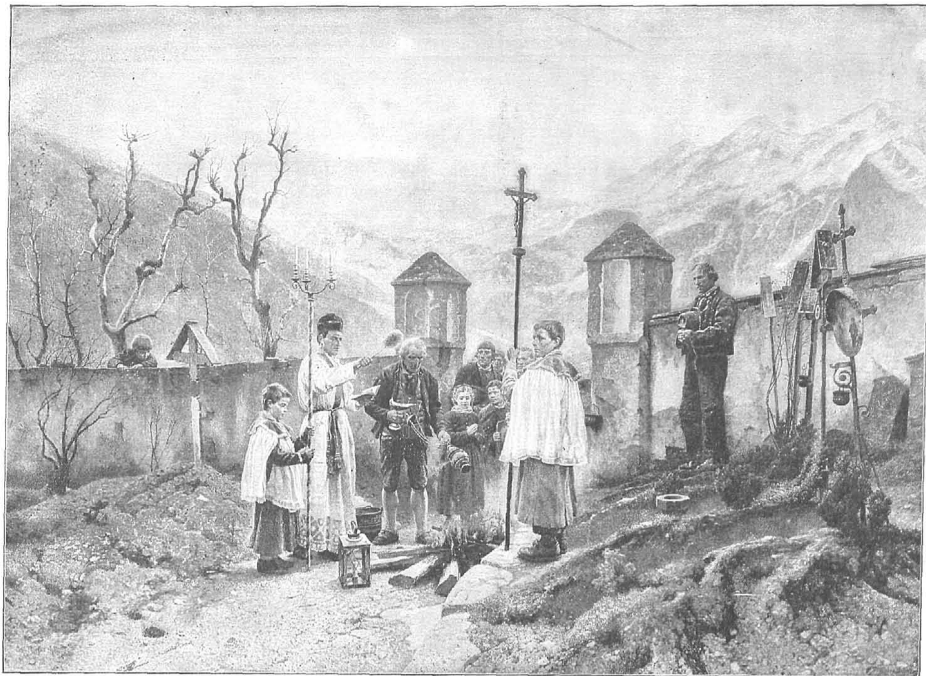
LA CONSAGRACIÓN DEL FUEGO, cuadro de Guillermo Riefstahl