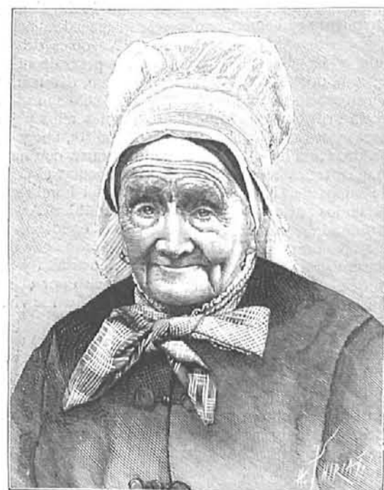
Retrato de la Sra. viuda de Nourry, de 102 años de edad. (De una fotografía.)