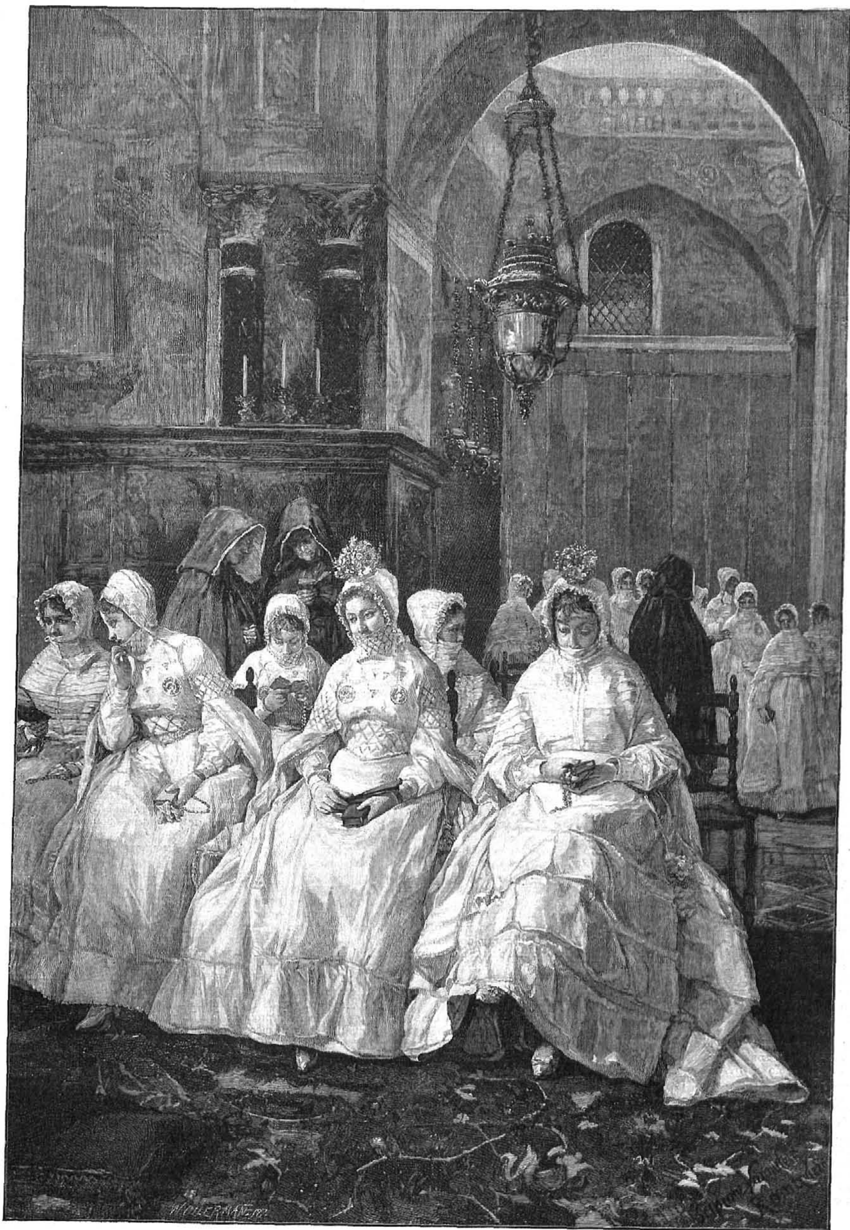
LA PRIMERA COMUNIÓN, cuadro de Escipión Vanutelli