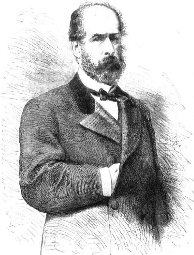
CHILE.—DON FEDERICO ERRAZURIZ, NUEVO PRESIDENTE DE LA REPUBLICA

Ese cabo suelto más habrá en la situación de Europa, tan llena de peligros y de dificultades por todos lados; esa cuestión quedará pendiente, como otra espada de Damócles, sobre la península italiana. Porque, ¿á quién se le oculta el efecto que produciría en el mundo católico la salida de Roma del anciano ilustre y venerable, que se sienta todavía en la silla de San Pedro?