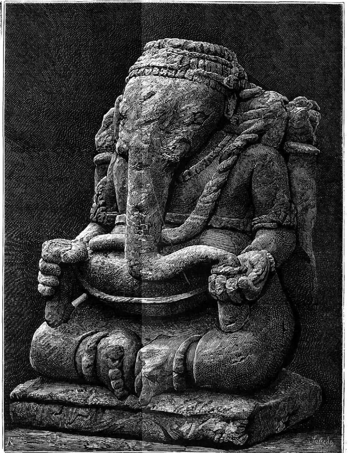
ÍDOLO DE LA ISLA DE JAVA.