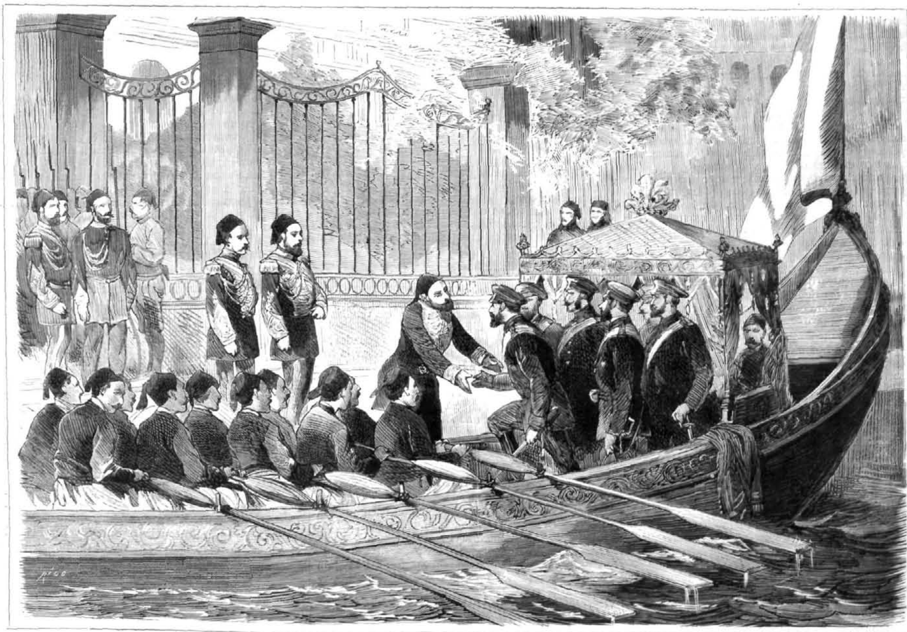
LOS GENERALES AHMED VEFIK PACHÁ Y REOUF PACHÁ RECIBEN A S. A. I. EN EL PALACIO DE DOLMA-BAGTCHÉ, EL 26 DE MARZO ÚLTIMO.