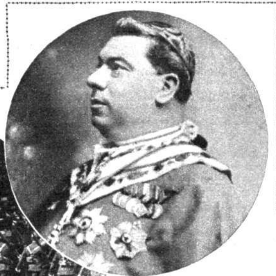
DON JUAN BENLOCH Y VIVÓ Cardenal

El trágico día 21 precisamente tenía lugar uno de los números más destacados del programa, consistente en un raid aéreo que había de cubrir el siguiente itinerario: Burgos, Vitoria, Logroño, Burgos. Toda la aviación española se había concentrado en la capital de Castilla la Vieja para tomar parte en la prueba. En ella nos hallábamos cuando, de improviso, el general que mandaba la base aérea, en telegrama