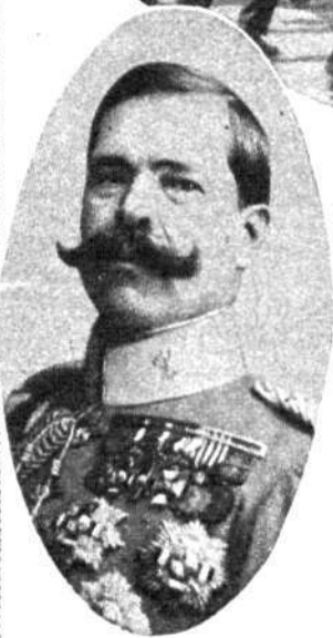
DON MANUEL FERNANDEZ SILVESTRE General, muerto en el desastre de Annual, en Julio de 1921

brava figura de moro notable, de joven aventurero español, tostada por todos los rigores caniculares, mecida por todos los vientos, pudiera ser tan del dominio público, tan conocida y admirada. Desde la Puerta del Sol hasta el Retiro, a lo largo del trozo más bello y más animado de la calle de Alcalá, cien manos han estrechado su mano, cien voces amigas han reverdecido el laurel de una amistad nacida las más de las veces en el campo de batalla, cien encuentros fortuitos han evocado el recuerdo de la patriótica y humanitaria gestión del célebre franciscano en la africana tierra, que, siquiera sea con el pensamiento, vamos a resucitar ahora.