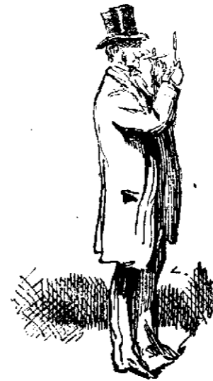
El más conveniente (á los fabricantes de cerillas).