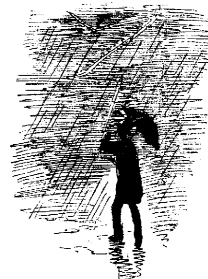
El más natural.