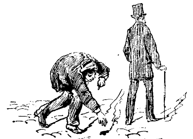
El más humilde.