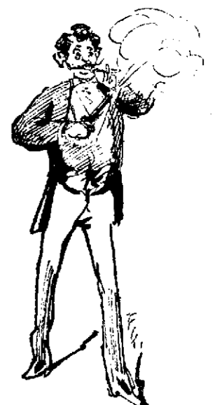
El más belicoso.