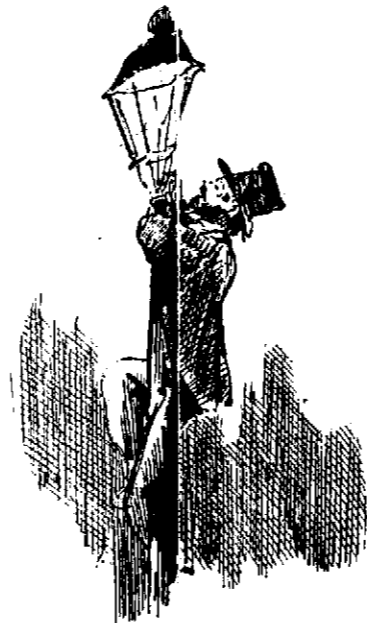
El más higiénico.