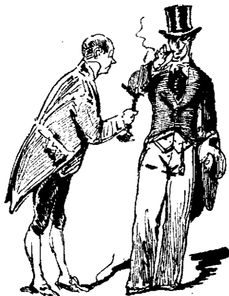
El más encopetado.