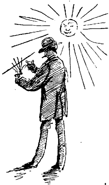
El más científico.