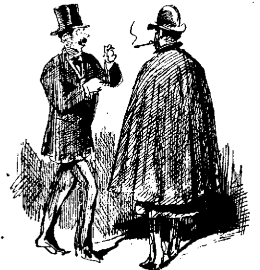
El más empalagoso.