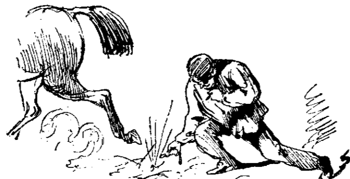
El más económico.