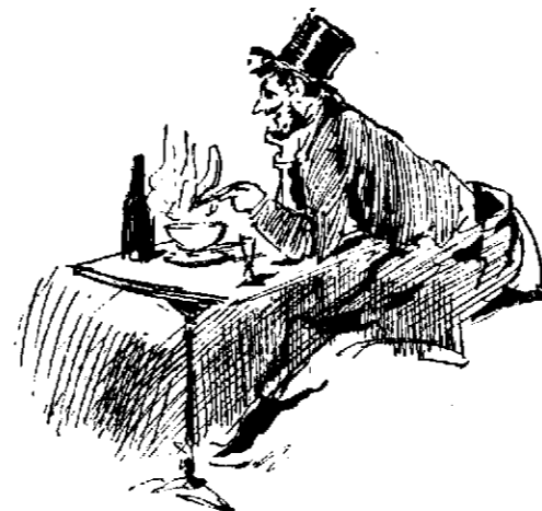
El más calavera.