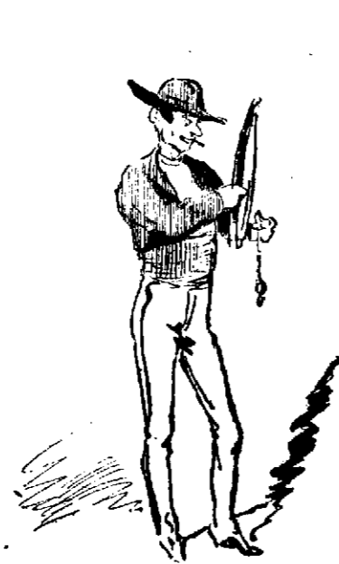
El más valeroso.