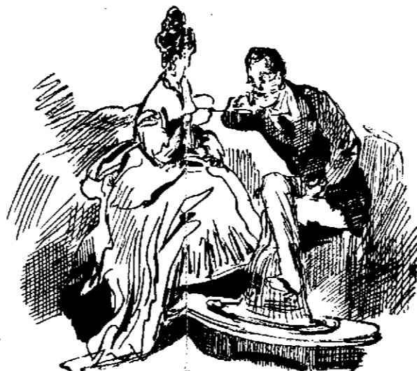
El más agradable.