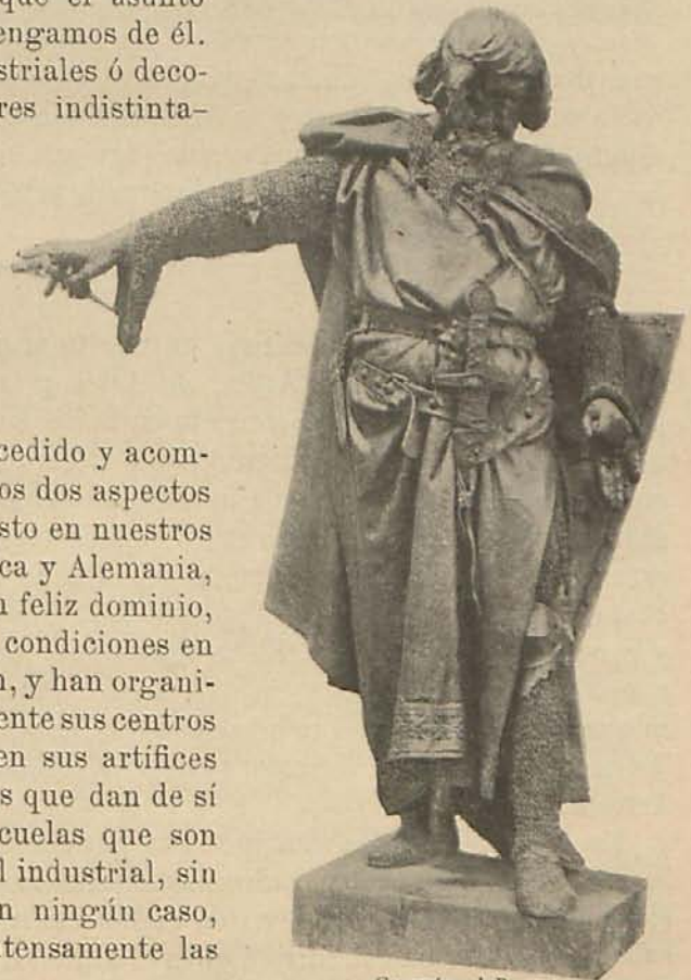
Guzmán el Bueno Estatua que corona el monumento que se erige en León Autor: Aniceto Marinas

Las artes llamadas, así en globo, industriales ó decorativas (se designan con los dos nombres indistintamente, aunque cada uno responda á distintas ideas), son en el extranjero materia de una preocupación honda y extendida entre los poderes públicos y las entidades que dirigen, asesoran, critican ó marchan paralelamente á la enseñanza; preocupación que no diremos que haya sido causa de su brillante florecimiento, pero sí que le ha precedido y acompañado hasta responder con igual éxito á los dos aspectos capitales que señalan la evolución del gusto en nuestros días. Inglaterra primero, más tarde Bélgica y Alemania, al fin Francia y Suecia han alcanzado tan feliz dominio, logrado por vías bien distintas, de las condiciones en que esas artes se producen y perfeccionan, y han organizado con arreglo á él tan sabia y eficazmente sus centros de enseñanza, que hoy no sólo producen sus artífices obras por todos conceptos superiores á las que dan de sí los españoles, sino que cuentan con escuelas que son planteles de artistas verdaderos, donde el industrial, sin perder su carácter, sin salirse de él en ningún caso, teniendo á orgullo el ostentarlo, siente intensamente las